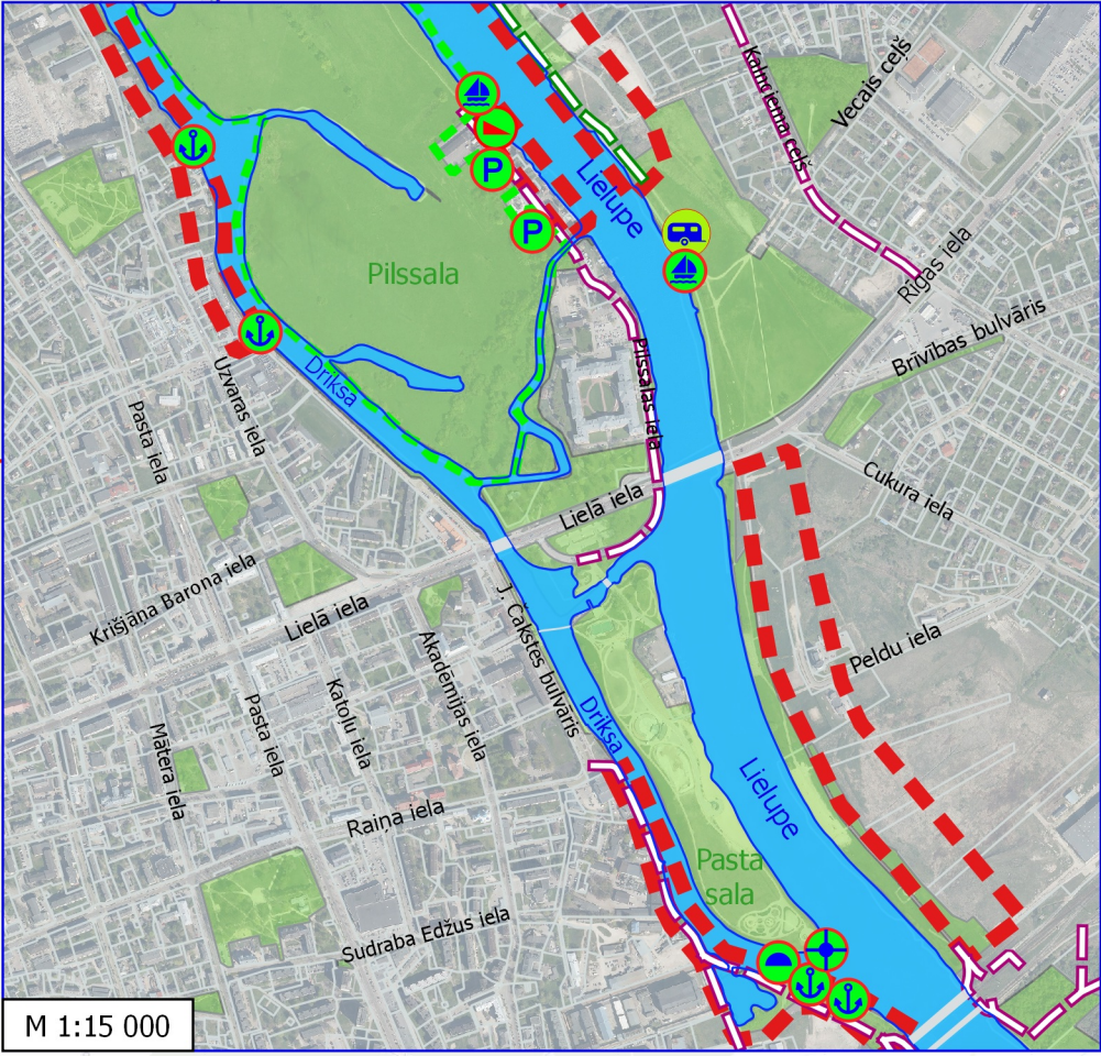
M 1:15 000