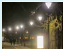
IEKŠPAGALMU, STĀVLĀUKUMU UN SKVĒRU SEGUMA REMONTAM.