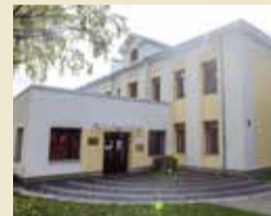
JELGAVAS AMATU VIDUSSKOLAS DARBĪBAS NODROŠINĀŠANAI.

1 982 095 € – Jelgavas speciālo skolu (Jelgavas pamatskolas «Valdeka»-attīstības centra un Jelgavas Paula Bendrupa pamatskolas) un speciālās pirmsskolas izglītības programmas darbības nodrošināšanai. 1 301 951 € – Jelgavas Amatu vidusskolas darbības nodrošināšanai. 1 129 330 € – interešu izglītības nodrošināšanai. 298 851 € – Jelgavas Mākslas skolas darbības nodrošināšanai. 1 458 959 € – Zemgales reģiona Kompetenču attīstības centra darbības nodrošināšanai.