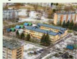
PII «KAMOLĪTIS» TERITORIJAS LABIEKĀRTOŠANAS BŪVPROJEKTA IZSTRĀDEI (CEĻI, CELIŅI, KOMUNIKĀCIJAS, ĀRĒJĀS APGAISSOMS, APSTĀDĪJUMI, LABIEKĀRTOŠANAS ELEMENTI).