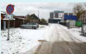
CELTNIEKU IELAS SEGUMA UZLABOŠANAI PĒC TEHNOĻĀRIJAS VIDUSSKOLAS REMONTDARBU PABEIGŠANAS.

348 900 € – pašvaldības ielu ikdienas uzturēšanai; • 110 000 € – melnā seguma bedrīšu remontam, iekšpagalmu, stāvlaukumu un skvēru seguma remontam; 210 000 € – ielu uzturēšanai ziemas periodā; 5000 € – ielu atputeļošanai. 42 845 € – satiksmes organizācijai; 14 745 € – ceļa zīmju uzturēšanai un uzstādīšanai; 28 100 € – satiksmes drošībai, tajā skaitā 16 000 € dažādiem satiksmes drošības pasākumiem (ātrumvaļņi, drošības barjeras u.c.); 12 100 € – ielu meteoroloģisko staciju uzturēšanai. 85 000 € – ielu kapitālajam remontam un rekonstrukcijai; 50 000 € – būvprojekta izstrādei Lielupes tilta uzturēšanai un deformācijas šuvju atjaunošanai; 35 000 € – daļējai Celtnieku ielas seguma uzlabošanai pēc Tehnoloģiju vidusskolas remontdarbu pabeigšanas. 10 000 € – ietvju uzturēšanai. 15 500 € – autobusu pieturu uzturēšanai. 40 000 € – pilsētas tiltu uzturēšanas darbiem: apauguma novākšanai, gūļju skalošanai, krāsošanai, margu labošanai un krāsošanai, Baložu tilta margu krāsošanai, Bauskas tilta apauguma novākšanai, obligātajai tiltu inspekciju veikšanai saskaņā ar grafiku; 25 000 € – Bāra ceļa gājēju laipas atjaunošanai. 335 374 € – izglītības iestāžu teritoriju kopšanai. 1 277 054 € – pašvaldības publisko teritoriju kopšanai: ietves, parki, skvēri u.c.