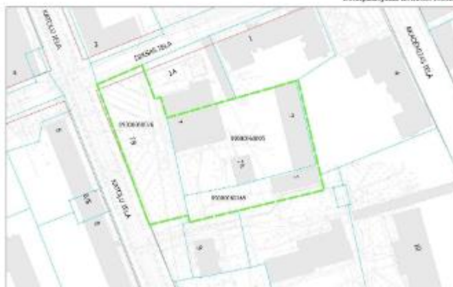
Detālplānojuma izstrādes robeža

Sandra.Ozola@dome.jelgava.lv, kā arī informācija pieejama pašvaldības tīmekļa vietnē www.jelgava.lv un Latvijas ģeotelpiskās informācijas portālā www.geolatvija.lv sadaļā "Teritorijas attīstības plānošana".