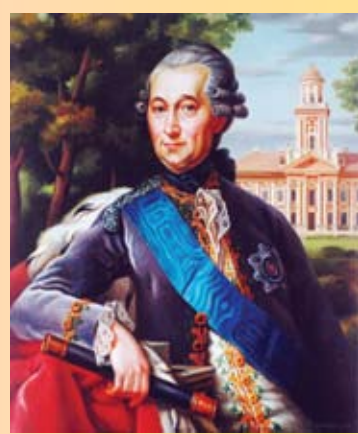
Attēls: M.Stumbra glezna «Hercogs Pēteris Bīrons» (2000)

Avots: Ģederta Eliasa Jelgavas Vēstures un mākslas muzejs