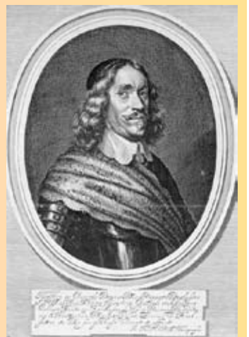
Attēls: Zviedru Vidzemes ģenerālgubernators Roberts Daglass