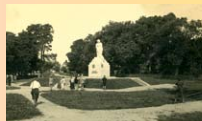
Attēls: Stacijas parks

Stacijas parks atrodas aiz pilsētas vēsturiskā vaļņa pie ceļa, kas no Annas (Nabagu, Posta) vārtiem veda uz hercoga īpašumiem Vīrcavā. Teritorija izmantota kā kapsēta (pilsētas nabagiem un patversmju iemītniekiem) jau pirms 1845. gada, kad te uzcēla Svētā Jāņa luterāņu draudzes baznīcu, kurai blakus iekārtoja tā sauktos Jāņa kapus. Iepretim tiem atradās Literātu kapi, kuros apbedīja dižcilvēkus Jelgavas vāciešus. Svarīgi notikumi Stacijas parka vēsturē ir vairāki – 1868. gadā atklāja dzelzceļa satiksmi ar Rīgu, bet 1870. gadā uzcēla arī stacijas ēku, kura cietusi un pēc tam atjaunota abos pasaules karos. 1895. gadā rajons ap dzelzceļa staciju bija iesaistīts 4. Vispārējo dziesmu un mūzikas svētku aktivitātēs, notika Lauksaimniecības, amatniecības un rūpniecības darbu izstāde.