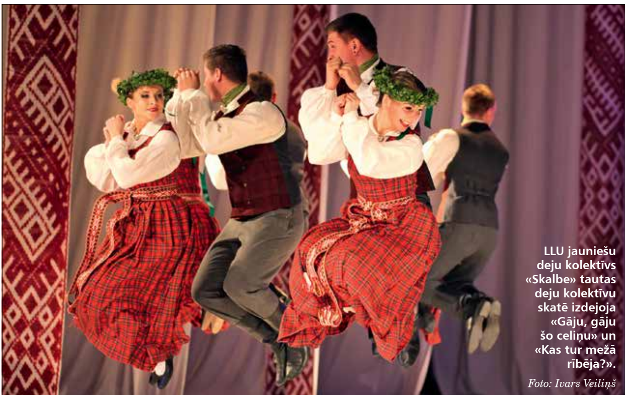
LLU jauniešu deju kolektīvs «Skalbe» tautas deju kolektīvu skatē izdejoja «Gāju, gāju šo celiņu» un «Kas tur mežā rībēja?».