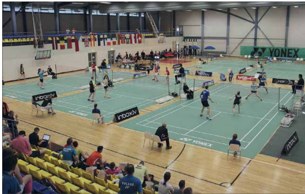
No 2. līdz 5. jūnijam Jelgavā pirmo reizi norisinājās starptautiskas badmintona sacensības «Yonex Latvia International 2016», kurās piedalījās 190 sportisti no 20 valstīm.

Jelgavas turnīrā piedalījās 190 dalībnieki no 20 valstīm, arī 28 spēlētāji