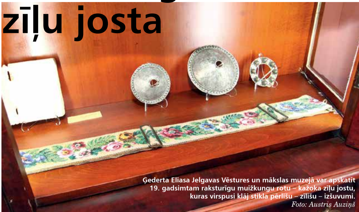
Ģederta Eliasa Jelgavas Vēstures un mākslas muzejā var apskatīt 19. gadsimtam raksturīgu muižkungu rotu – kažoka zīļu jostu, kuras virspusi klāj stikla pērliņu – zīliņu – izšuvumi.