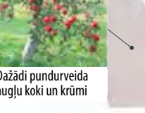
Dažādi pundurveida augļu koki un krūmi