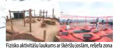
Fizisko aktivitāšu laukums ar šķērslu joslām, reljefa zonu ar kalniņiem, vieta bumbu spēlēm un kustību rotaļām