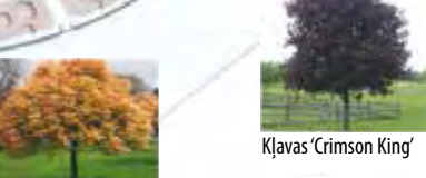
Kļavas 'Crimson King'