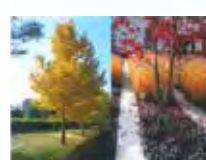
Ainaviski dekoratīvi stādījumi

Teritorijas ārējais perimetrs vizuāli norobežots ar stādījumiem. Piebraukšanai paredzēts izmantot abas jaunizbūvējamās ielas. Autostāvvietas izvietotas pa visu ēkas perimetru, nodrošinot vecākiem un bērniem maksimālu komfortu.