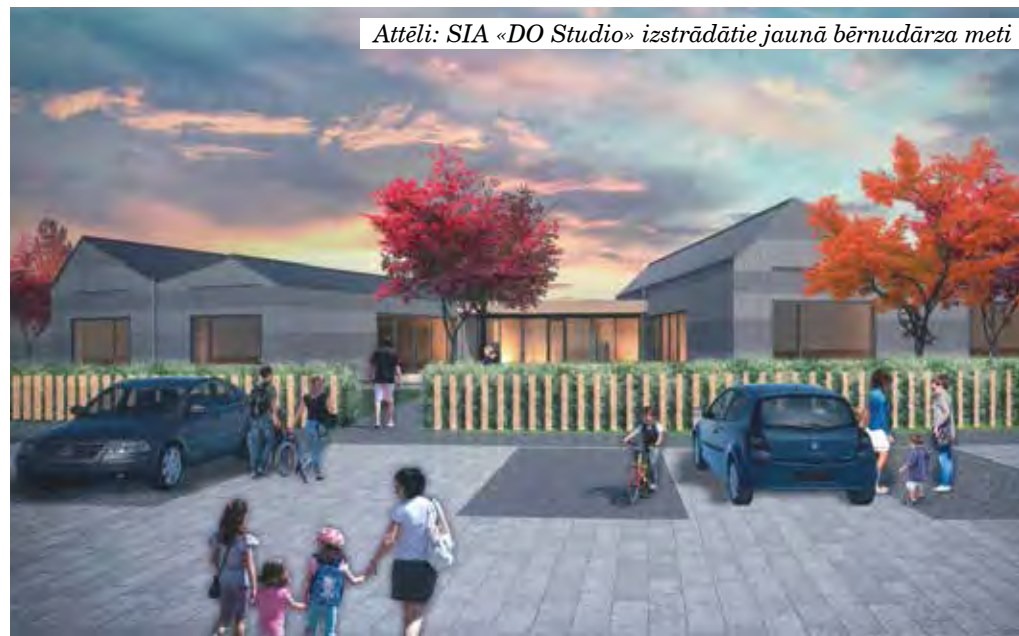
Attēli: SIA «DO Studio» izstrādātie jaunā bērnudārza meti