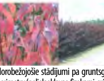
Norobežojšie stādījumi pa gruntsgabala perimetru (nelielas kļavas, fizokarpi, grimoni)