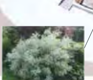
Brīvi augošs dzīvzogs – grimonis 'Balhalo'