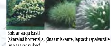
Sols ar augu kasti (skarainā hortenzija, Ķīnas miskante, lapsastu spalvuzāle un vasaras puķes)