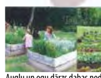
Augļu un ogu dārzs dabas nodarbibām