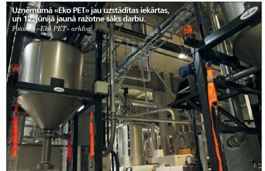
Uzņēmumā «Eko PET» jau uzstādītas iekārtas, un 12. jūnijā jaunā ražotne sāks darbu.

Ražotne atradīsies Jelgavā, bijušajā RAF teritorijā, kur jau strādā «PET Baltija» – ražotnes telpas jau renovētas un iegādātas arī nepieciešamās iekārtas.