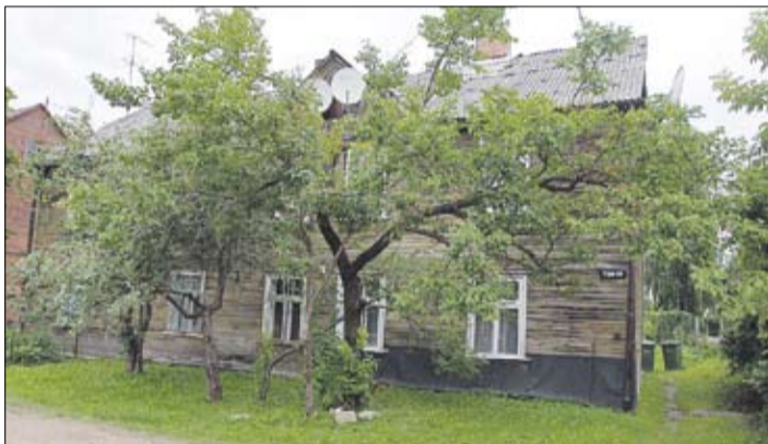
Jūnija sākumā Tirgoņu ielā 9 pārdots trīsistabu dzīvoklis (platība – 42,7 kvadrātmetri) par 1500 latiem (35 latus kvadrātmetrā) – tā ir šogad zemākā reģistrēto trīsistabu dzīvokļu darījumu summa. Nekustamā īpašuma speciālisti uzskata, ka Jelgavā nav neviena mājokļa, kura vērtība būtu mazāka par 100 latiem kvadrātmetrā.