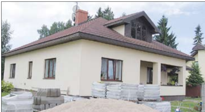
Pirmajā pusgadā lielākā summa, par kādu Jelgavā reģistrēts nekustamā īpašuma darījums, ir 67 002 lati. Tik maksāja šī privātmāja 3. līnijā.