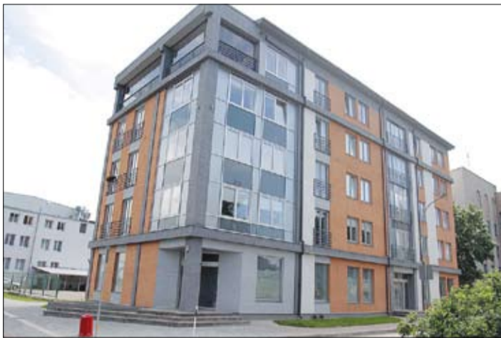
Nekustamā īpašuma speciālisti uzskata, ka šobrīd visekskluzīvākie un dārgākie dzīvokļi ir Raiņa ielā 3a. Tas ir jauns projekts un atrodas pilsētas centrā. Informācija projekta mājas lapā liecina, ka šobrīd no 27 dzīvokļiem 17 vēl ir brīvi.