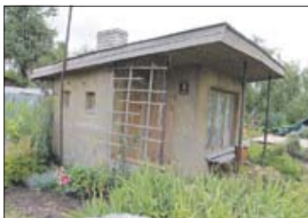
Abi šie īpašumi – Melleņu ielā 25 un Saulaines ielā 9 – pārdoti par 2000 latu, sadalot pirkumu divās daļās. Šogad šādi darījumi, kad īpašums pārdots pa daļām, bijuši vairāki, un nekustamā īpašuma speciālisti pieļauj, ka tas tiek darīts, lai samazinātu valstij maksājāmās nodevas apmēru vai apietu pašvaldības pirmpirkuma tiesības.

nozarē, rēķinot vidējo cenu, šādi aizdomīgi darījumi par ļoti zemām summām netiek ņemti vērā. «Atmetot šādus darījumus, redzam, ka vidēji kvadrātmetra cena Jelgavā svārstās no 201 līdz 222 latiem, kas tāda ir jau kopš 2010. gada sākuma ar atsevišķiem spīļiem momentiem, kad tiek pārdoti ļoti izremontēti dzīvokļi labās vietās,» tā viņš, piebilstot, ka visdārgākie ir vai nu dzīvokļi jaunajos projektos, vai ļoti labi izremontēti dzīvokļi labās vietās (centrā un tuvākajā apkārtnē).