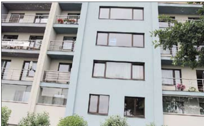
Pirmajos sešos šā gada mēnešos absolūta lidere ar pārdoto dzīvokļu skaitu ir daudzdzīvokļu māja Tērvetes ielā 88 – tur pārdoti 14 dzīvokļi: trīs vienistabas, četri divistabu, septiņi trīsistabu.