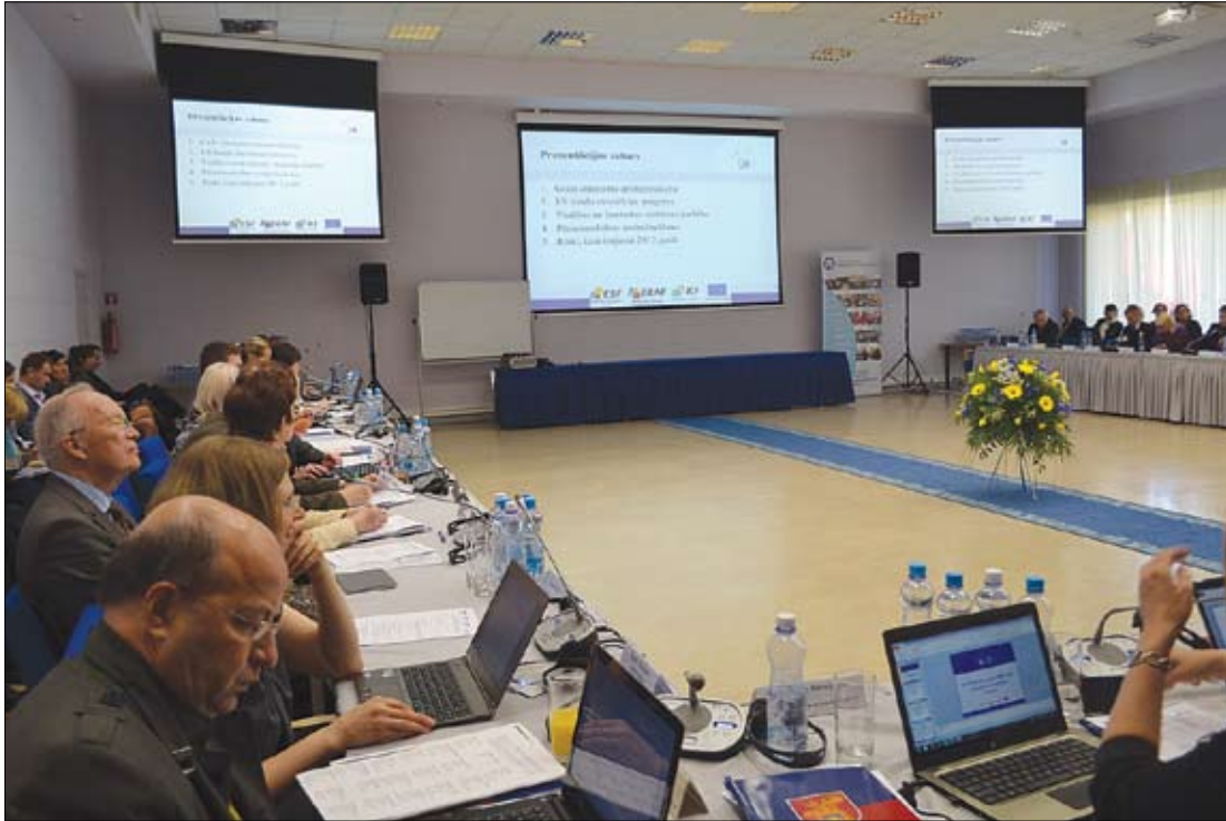
Liels ieguvums jaunajā mācību gadā ir ZRKAC modernī aprīkotā lielā konferenču zālē, kur šobrīd vienlaicīgi var pieslēgt 100 datorus, lietot bezvadu internetu un nodrošināt tulkošanas iespējas.