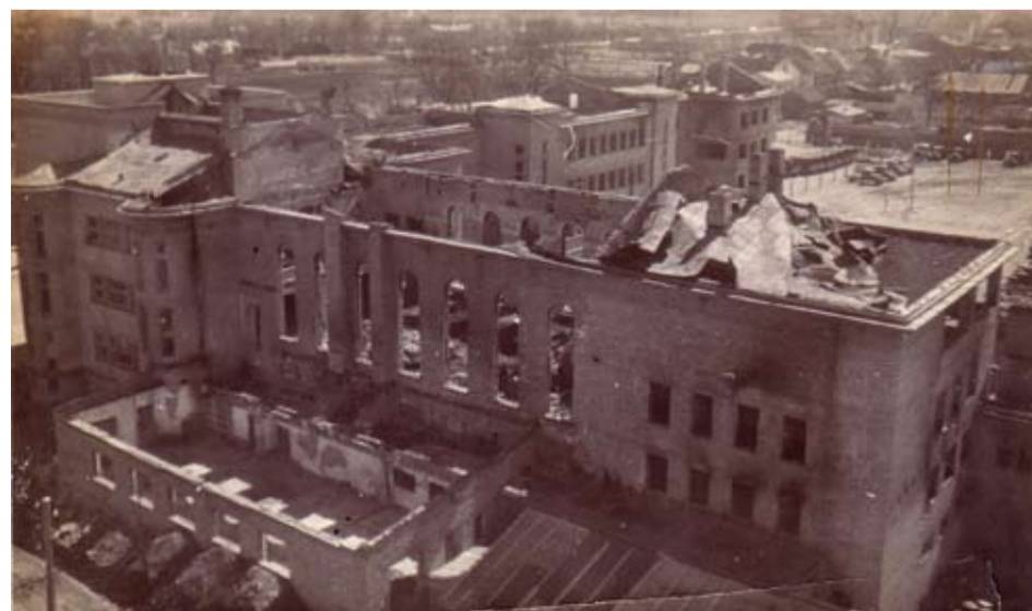
Sagrautā 15. maija pamatskola (tagadējā Jelgavas Valsts ģimnāzija).