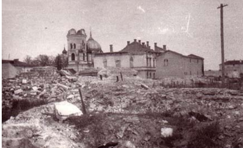
Nopostītā Sv. Simeona un Sv. Annas pareizticīgo baznīca.

ras vidusskolas, pedagoģiskā un mūzikas skola, kopējais skolēnu skaits bija 3000. Pēc 1945. gada datiem, no pirmskara iedzīvotāju skaita Jelgavā atgriezās tikai ap 40 procentiem – 15 800.