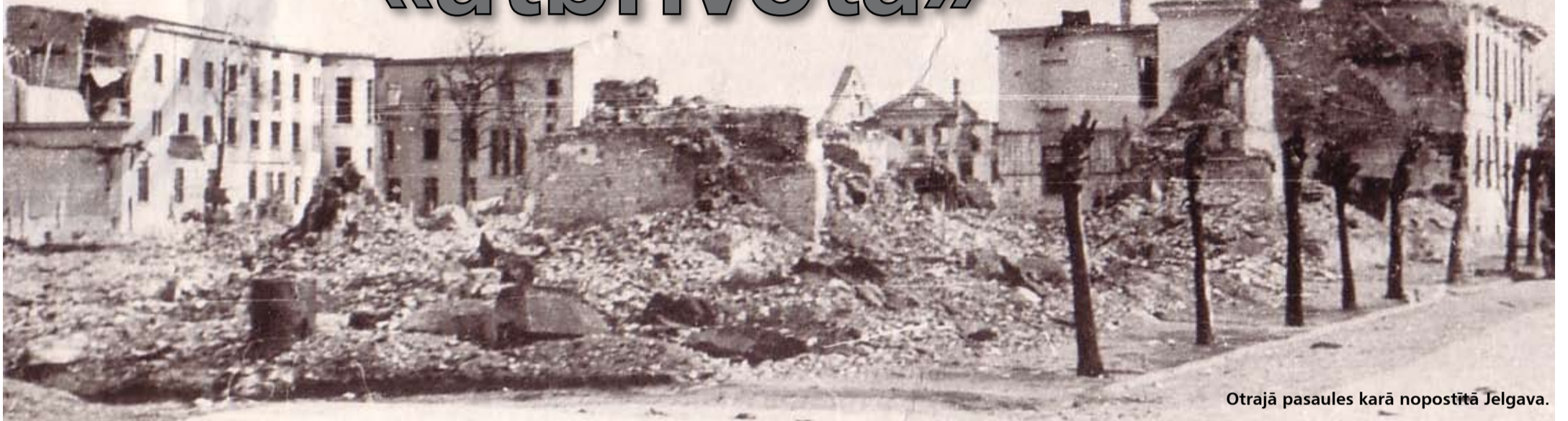
Otrajā pasaules karā nopostītā Jelgava.