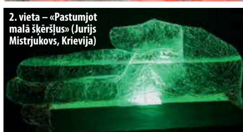
2. vieta – «Pastumjot malā šķēršļus» (Juris Mistrjukovs, Krievija)