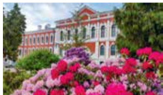
Pie mums vasaras saulgrieži un zied viss – mārpuķītes, spirejas, rododendri, zeltlietus un pat Akadēmiskā ceļa bruģis.