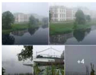
Kad pilsēta mostas...