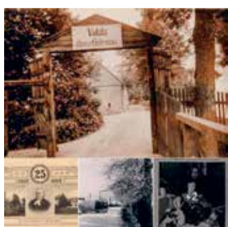
Šodien slimnīcai «Gintermuiža» aprit 135 gadi kopš tās dibināšanas 1887. gada 3. jūnijā. Laikam ritot, esam nemitīgi attīstījušies. Arī tagad mēs turpinām iet ar skatu uz priekšu, uz vēl pilnveidotāku un labāku garīgās veselības aprūpi! Fotogrāfijas – ainas no mūsu vēstures.