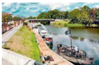
Aicinām siltajās vasaras dienās Jelgavā atpūties uz ūdens! 🌞🌊🚣 Iespēja iepazīties ar ūdens tūrisma piedāvājumu Jelgavā 2022 – visitjelgava.lv