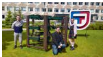
Jelgavas tehnikuma pagalmā ir tapusi Zaļā augu siena.