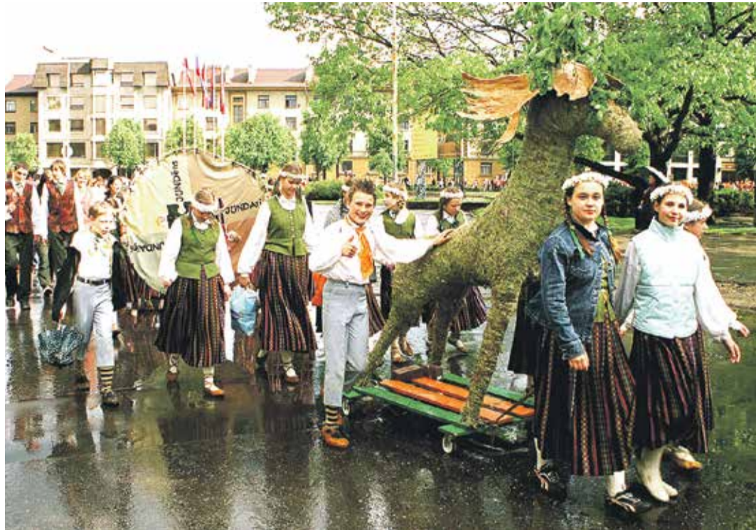
Jau rīt – svētku gājiens. Pagājušajā gadā «Junda» mūs pārsteidza ar pilsētas simbolu Alni. Ko varam gaidīt šogad?

Ipašs solās būt arī piektdienas koncerts «Tava un mana jaunības mūzika», kas jau pulksten 18 sāksies skvērā aiz kultūras nama. Tur kopā ar pūtēju orķestri «Rīga» vecāka gada gājuma cilvēki atmiņā varēs atsaukt savas jaunības dienas, bet jaunā paaudze ieklausīsies latviešu klasiķu – Raimonda Paula 60. – 80. gadu dziesmās. Līdzī dziedāt un dejot aicinās Latvijas Nacionālās operas solisti, Jelgavas kori un deju kolektīvi. Lai populārās dziesmas varētu dziedāt ikviens, pasākuma organizatori būs sarūpējuši dziesmu vārdus,