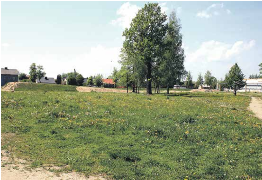
Jau pēc dažiem mēnešiem šāds Uzvaras parks būs vēsture – to labiekārtojot līdz septembra sākumam, pilsēta iegūs jaunu vietu nelielu kultūras pasākumu norisei

Vienlaikus parkā tiks atjaunotas arī sēdvietas, mazliet mainot to izvietojumu, bet nemainīgu atstājot sēdvietu skaitu – ap 1500. Tā kā parkā nav