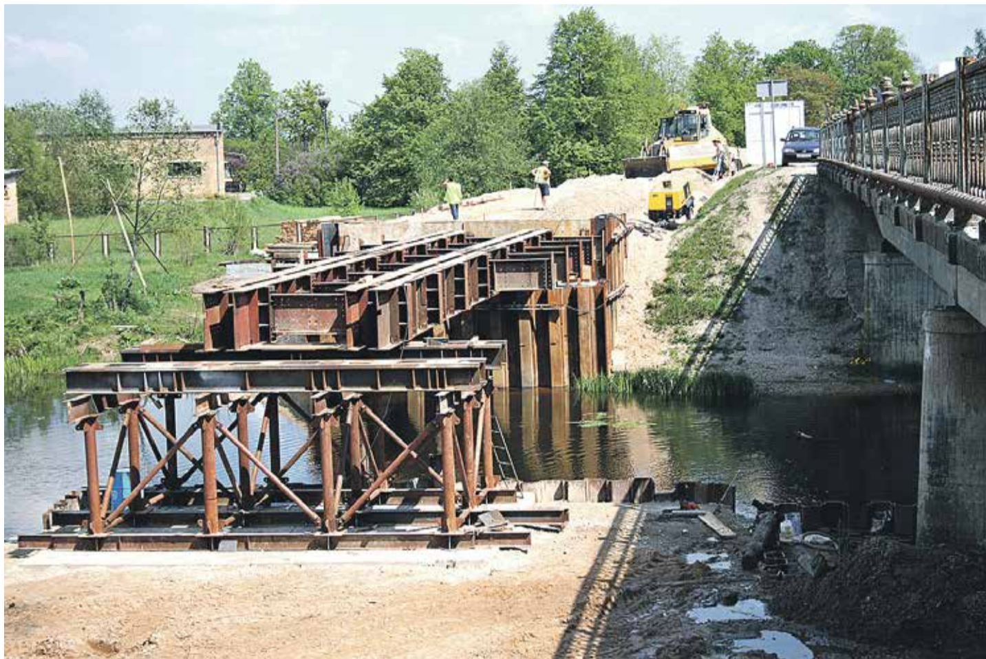
Līdz maijam beigām būs pabeigta pagaidu tilta būvniecība un tad sāksies arī pašreizējā Svētes tilta nojaukšana – tas nozīmē, ka satiksmes plūsma tiks novirzīta pa pagaidu tiltu.