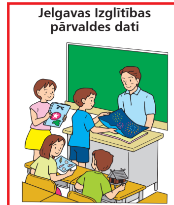
Jelgavas Izglītības pārvaldes dati