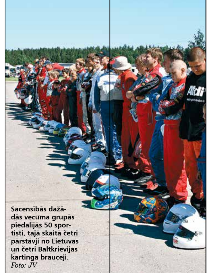
Sacensībās dažādās vecuma grupās piedalījās 50 sportisti, tajā skaitā četri pārstāvji no Lietuvas un četri Baltkrievijas kartinga braucēji.