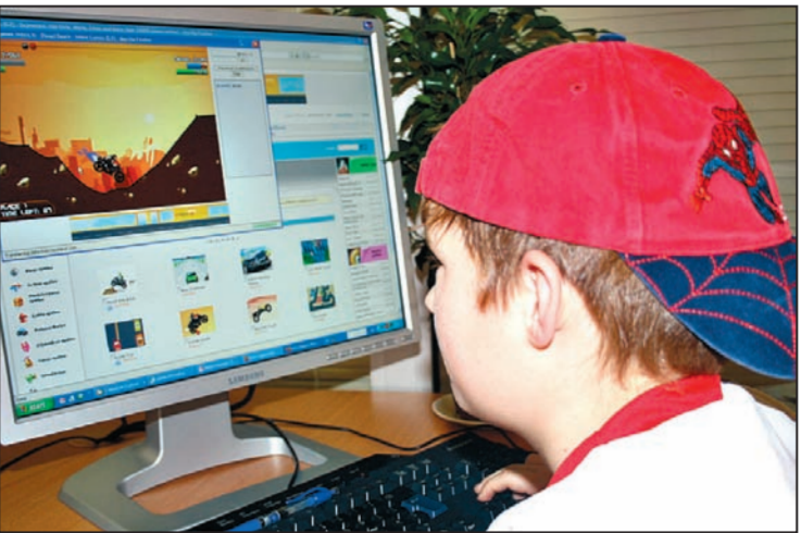
Dators nevienā vien ģimenē pazeminājis skolēnu sekmes – internetā pavadītais laiks visbiežāk tiek atrasts uz mācību rēķina.

Kā vienu no risinājumiem skolēnu nesekmības izskausanai G.Auza min individuālās skolotāju konsultācijas. «Bieži vien tās apmeklē skolēni, kuriem ir robežgadījumi, piemēram, vērtējums starp 5 un 6 ballēm, kā arī tie, kuriem ir augsts vērtējums, taču grib iegūt vēl labākas zināšanas. Tomēr lielāka problēma ir skolēniem, kuri vērtējums ir 2 un 3 balles, taču viņiem diemžēl nav motivācijas apmeklēt skolotāju konsultācijas un pārvarēt sevi. Ģimenei kopā ar skolu un profesionāļu – gan ģimenes ārsta, gan