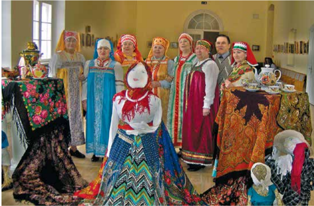
Jelgavas krievu kopienas «Istok» pārstāvji Jelgavas pils aulā – svinot vienus no saviem atzīmējamajiem svētkiem – Masļenicu – 2005. gada martā.