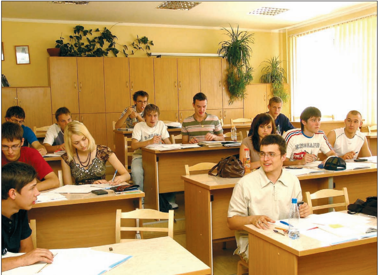
Šajā klasē nesekmīgos skolēnus varat nemeklēt – gan statistika pierāda, gan Jelgavas Valsts ģimnāzijas audzēkņi uzsver, ka vidusskolas klasēs jaunieši ir daudz motivētāki mācīties. «Mūsu vidū nesekmīgo nav, jo mēs apzināmies izglītības nozīmi,» tā vidusskolēni.

Savukārt bērns, jau labi apradis ar apstākļiem, sāk piekopt mānīšanos – vecāks no rīta agri dodas uz darbu, bērns it kā pieceļas, bet līdz skolai nenonāk. Savukārt vakarā viņš, garām skrīenot, aizņemtajai mammai vai tētim parāda dienasgrāmatu, aizpildītas darba burtnīcas, taču vecākiem nav ne jausmas, kā viņš skolā vispār nav bijis un paraksti, kādi vērtējumi veikti ar atvases roku. Nākamais solis jau ir bailes, kad