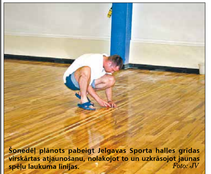
Šonedēļ plānots pabeigt Jelgavas Sporta halles grīdas virskārtas atjaunošanu, nolakojot to un uzkrāsojot jaunas spēļu laukuma līnijas.

«Ēkā ir ļoti veca elektrifikācijas sistēma. Pirmajā stāvā tā nomainīta pirms kāda laika, šogad plānots to izdarīt arī ēkas otrajā un trešajā stāvā. Mainīs arī otrā un trešā stāva siltuma sistēmas, jo pēdējās ziemās pieredzēti vairāku radiatoru bojājumi un pat to pārsprāgšana. Remontdarbu veicēju konkurss, kurā piedalījušies divi pretendenti, ir noslēdzies, taču tagad tiek gaidīta līguma parakstīšana 25. jūnijā. Plānots, ka darbus sāks tūlīt pēc Jāņiem, bet beigt paredzēts 1. oktobrī, lai rudens mēnešos sportisti trenētos svaigi izremontētajās telpās,» tā direktors.