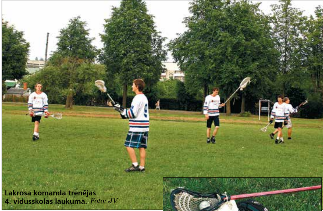
Lakrosa komanda trenējas 4. vidusskolas laukumā.

Lakross pirmo reizi Latvijā parādījās 2002. gadā, kad treneris no Anglijas iepazīstināja mūsu valsts sporta skolotājus ar interesantu spēli, kas cēlusies no Ziemeļamerikas indiāņiem, kļūstot par Ziemeļamerikas senāko sporta veidu. Lakross ir hokeja priekštecis un populārākais vasaras sporta veids Kanādā. Tā ir ātrākā komandu sporta spēle, kur vienlaicīgi uz laukuma ir deviņi spēlētāji un vārtu sargs. Laukums ir nedaudz mazāks kā lielajā futbolā. Lakrosu spēlē ar speciālām nūjām – pussargiem un uzbrucējiem tās ir nedaudz garākas par metru, taču aizsargiem – divreiz garākas, un to galos atrodas speciāli ķeramie tīkliņi, kas pīti no auklas, lina, ādas vai kāda sintētiska materiāla un izlocīti līdzīgi trīsstūrim. Vēl vajadzīga pēc izvēles balta, dzeltena vai oranža gumijas bumbuņa, kuru katrs spēlētājs ar savu nūju met, ķer, padod citam, lai gūtu vārtus, kā arī aizsargķivere ar sejas masku, cimdī, ceļu aizsargi un plecursargi. Amerikā ekipējums izmaksā aptuveni 100 – 150 latu, taču Eiropā – divas reizes