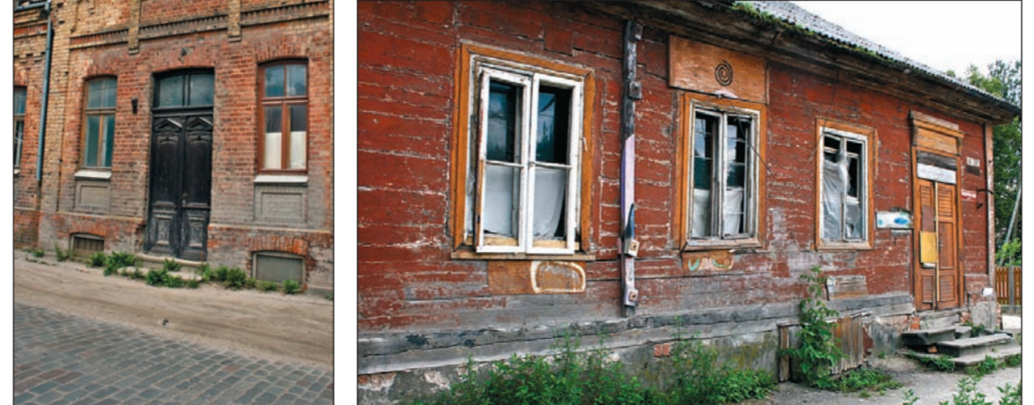
Ēka Dobeles ielā 68 ir viena no senākajām mūra celtnēm, un tā ar laiku noteikti iekļausies kopējā Vecpilsētas arhitektūrā.

Diemžēl vairākas mājas Vecpilsētas ielā ir tikai soli no sagrušanas, taču tajās dzīvo cilvēki. 2. nāms ir privatīpašums, taču tajā mītina's kādas ģimēne – galvenokārt mazzirģis, tādejā iespēju, lai nāma saglabāšanā ieguldītu kaut niecīgus līdzekļus, nav, un ēka pamazām top par graustu.