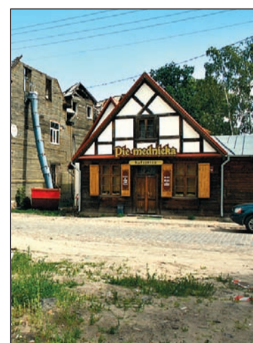
Nams Vecpilsētas ielā 15/19, kur izvietota kafējca «Pie mednieka», ir «zelta vidusceļš», jo nav restaurēts, bet atjaunots kā butaforija – fasāde apšūta, taču izveidota ar pildzēģiem, slēģiem – gluži kā senajā Jelgavā.

Vieta, ko pašlaik sauca par Vecpilsētas centru, agrāk bija Mītavas nomale, jo sabiedriskā dzīve galvenokārt koncentrējās Hercoga Jēkaba laukumā. Tā bija pilsētas daļa, kur mīta amatnieki. Vecpilsētas iela ir nepilnu kilometru gara. Tajā ir nāmi, kas celti 18. un 19. gadsimta 20.–30. gados, mījas ar ēkām, kuras uzlietas padomju gados. «Jelgava nevar lepoties ar Vecpilsētu tā tiešajā nozīmē,