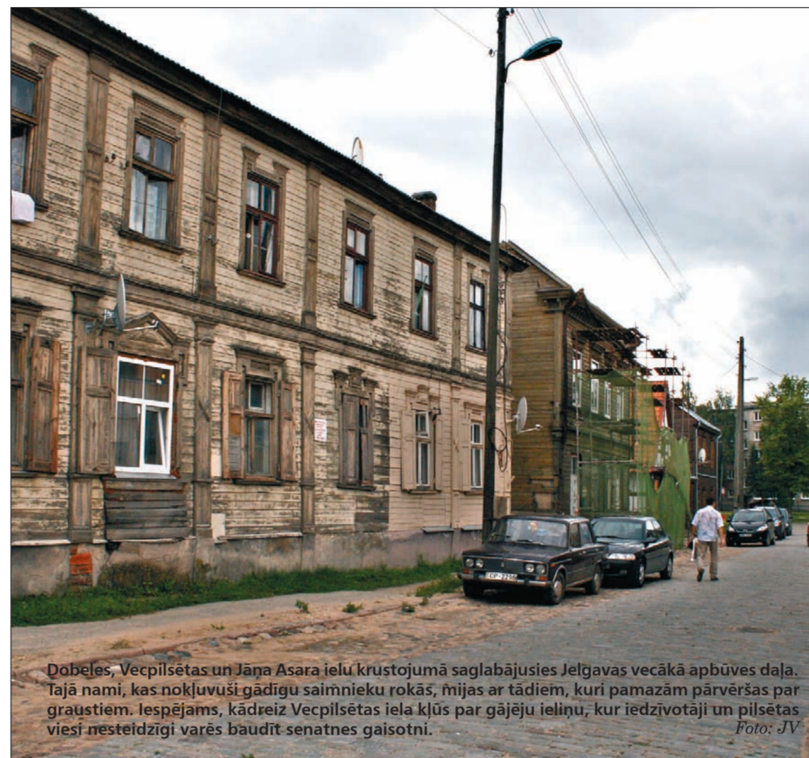
Dobeles, Vecpilsētas un Jāņa Asara ielu krustojumā saglabājies Jelgavas vecākā apbūves daļa. Tajā nāmi, kas nokļuvuši gādīgu saimnieku rokās, mījas ar tādiem, kuri pamazām pārvēršas par graustiem. Iespējams, kādreiz Vecpilsētas iela kļūs par gājēju ielīņu, kur iedzīvotāji un pilsētas viesi nēstēdzīgi varēs baudīt senātnes gaisotni.