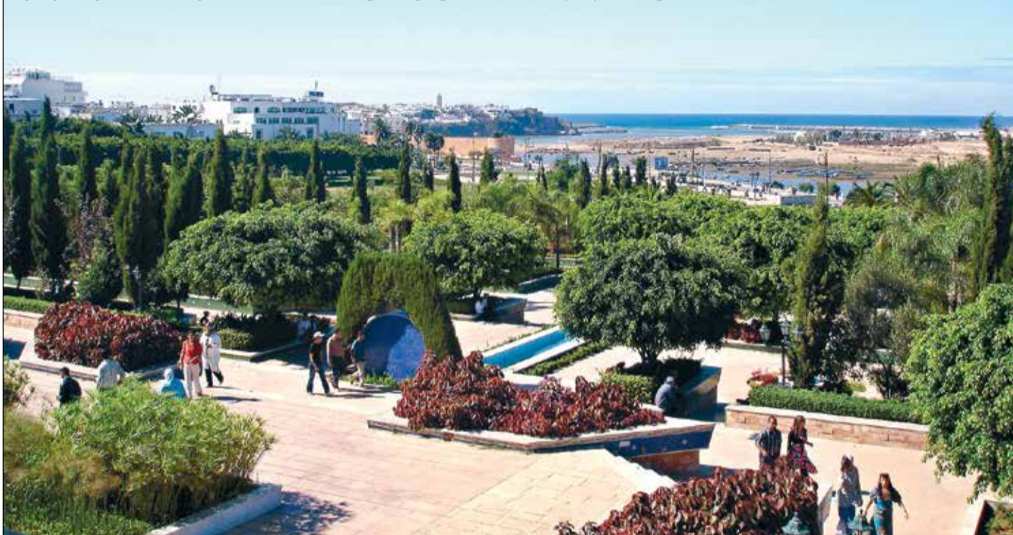
Ir arī tādi jelgavnieki, kas naudu nežēlo un piepilda, iespējams, savu mūža sapni, aizbraucot uz Maroku pēc mandarīniem un «karstajiem» iespaidiem. Viņi noteikti būs viesojušies Marokas galvaspilsētā Rabatā, kas vilina ar balto ēku apbūvi un zaļo pilsētas zonu.

Pilnā sparā rit vasaras atvaļinājumu laiks, un ikviens jelgavnieks vēlas atpūsties pēc kārtējā darba cēliena, lai pēc jauki pavadītām brīvdienām ar jaunu darbu sparā turpinātu ikdienas gaitas. Laiks rit, un viss, tostarp cilvēku vēlmes, mainās tam līdzīgi. Lielai daļai strādājošo vairs nepietiek ar atvaļinājuma baudīšanu piemājas dārzīnā, vasarnīcā vai zvilnēšanu jūrmalas smiltīs. Turklāt Latvijas laika apstākļi ir nepastāvīgi un nereti pievīl, jo ikviens, rezervējot brīvdienas datumus, rēķinājies ar siltu un saulainu laiku. Tādā gadījumā atliek vien izvēlēties pieņemamāko piedāvājumu, iegādāties biļetes, sakrāvēt čemodānus un doties atpūsties ārpus Latvijas robežām. Mūsu pilsētā pašlaik darbojas piecas tūrisma aģentūras, ar kuru palīdzību «Jelgavas Vēstnesis» centās noskaidrot, kurp dodas jelgavnieki un kādi tūristi viņi ir. Tūrisma aģentūru darbinieki atzīst, ka darba pietiekot, jo tuvos un tālos braucienos vietējie dodas visu gadu. Taču mainījušies gan ceļošanas veidi, gan pieprasījums, kas apliecina – ar katru gadu jelgavnieku mērķi kļūst augstāki un tālāki.