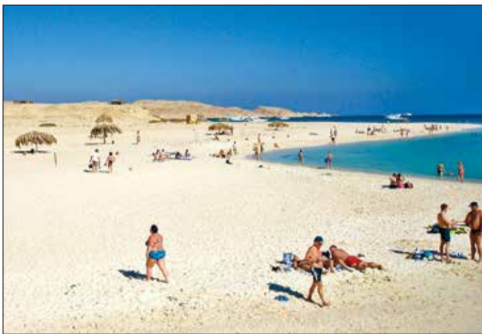
Tagad liela daļa tūristu labprāt izvēlas vairākas dienas vienkārši pagulēt jūras vai okeāna krastā, kur iespējams iegūt veselīgu iedegumu. Iecienītas ir Ēģiptes pludmales, kurās lielāks mūsējo pieplūdums vērojams rudens un ziemas mēnešos, kad Latvijā ir vēss, bet tur – patīkami silts.