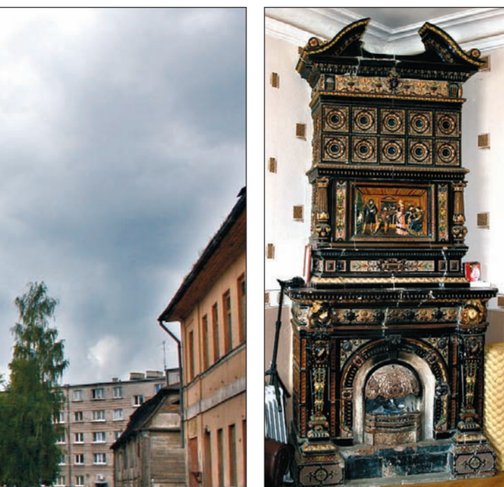
Šāds unikāls kamins no 18.–19. gadsimta mījas saglabājies vienā no Vecpilsētas namiem.

Diemžēl vairākas mājas Vecpilsētas ielā ir tikai soli no sagrušanas, taču tajās dzīvo cilvēki. 2. nāms ir privatīpašums, taču tajā mītina's kādas ģimēne – galvenokārt mazzirģis, tādejā iespēju, lai nāma saglabāšanā ieguldītu kaut niecīgus līdzekļus, nav, un ēka pamazām top par graustu.