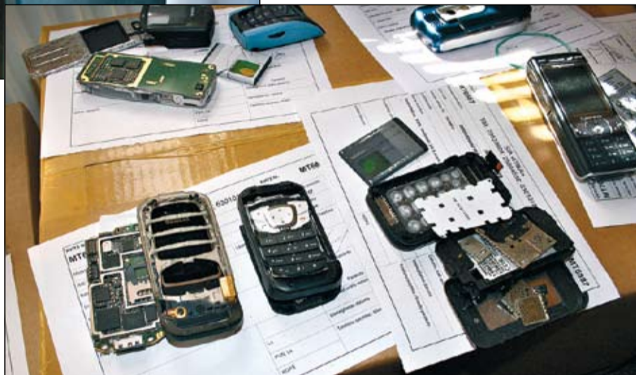
Visbiežāk mobilie telefoni bojājas, ja tiem piekļūst mitrums, un peld sezonā tas notiek itin bieži.