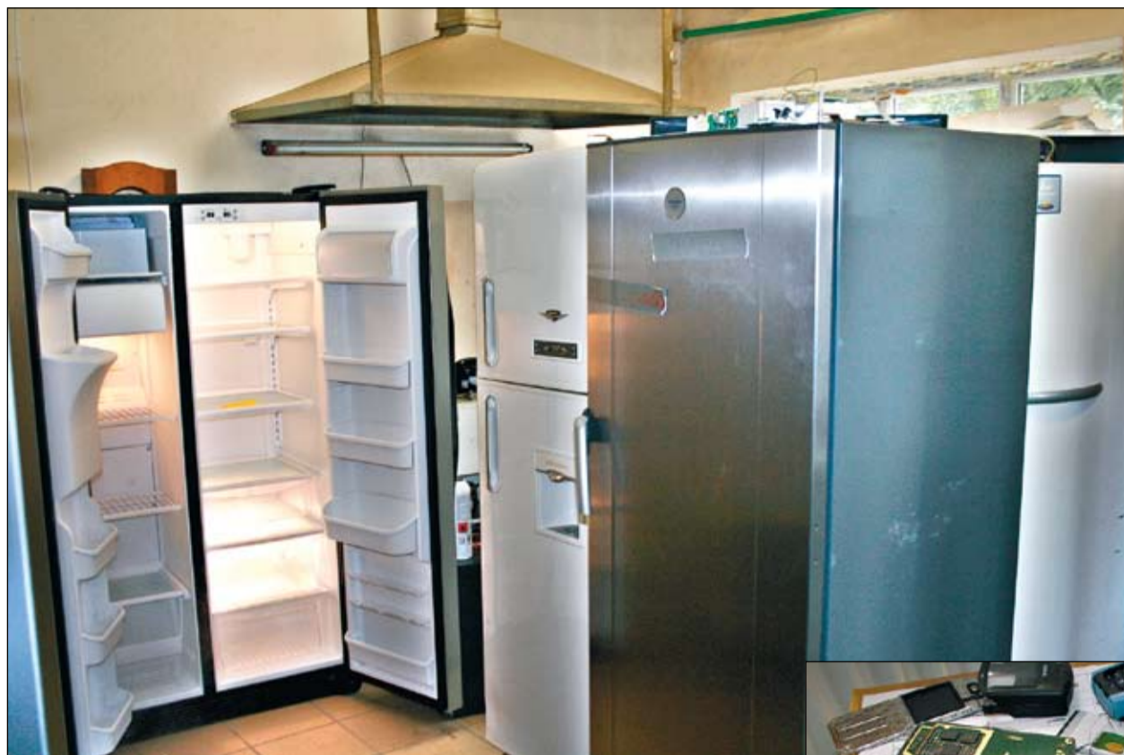
Ledusskapjiem postu nodara strāvas piegādes traucējumi, nepareiza ekspluatācija un dzīvnieki, kas tajos iekļūst.