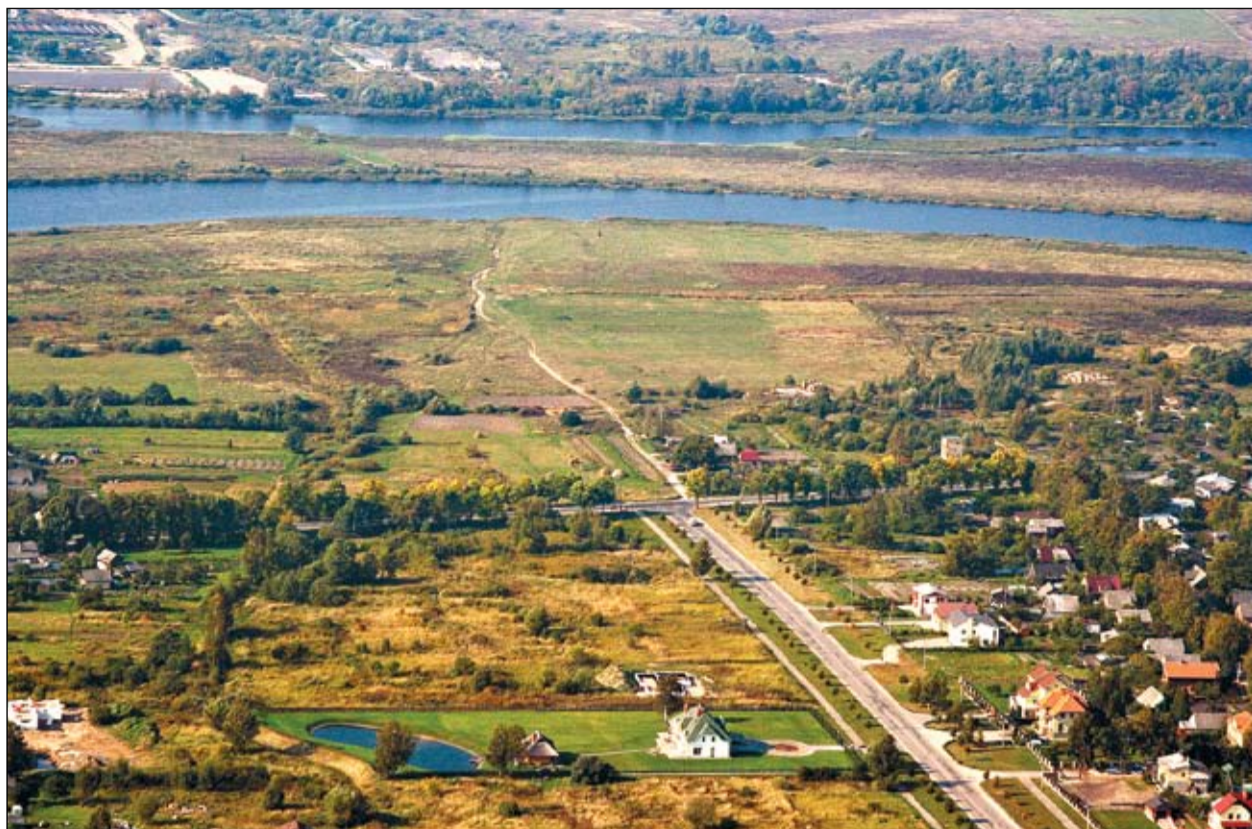
Šajā vietā perspektīvā paredzēts izbūvēt Ziemeļu tiltu. Vispirms tiks rekonstruēta Loka maģistrāle un Atmosas iela, lai pēc 2013. gada varētu sākt plānot tilta būvniecību.