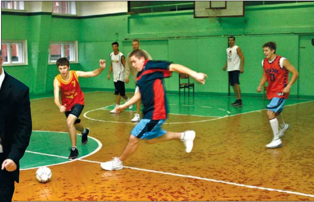
Gatavojoties izšķirošajām cīņām pret galvenajiem konkurentiem no Jūrmalas, netiek smārdēta arī vecā labā gimnāzijas sporta zāle.