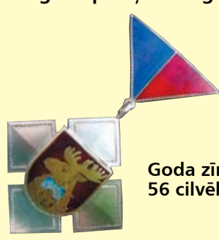
Goda zīme piešķirta 56 cilvēkiem