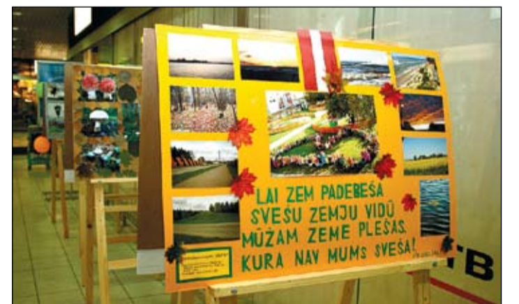
Izstādē «Vivo centrā» patlaban apskatāmi gandrīz 40 skolēnu veidoti fotodarbi. Organizatori atzīst, ka tas ir lielākais skaits izstādes vēsturē.

A.Mārtiņkrīsta stāsta, ka tā tapusi sadarbībā ar Jelgavas un rajona skolām un pirmsskolas izglītības iestādēm, kuru bērni radījuši izstādē apskatāmās fotogrāfijas, tādējādi veicinot bērnu un jauniešu pozitīvu, saprotošu, radošu attieksmi pret savu valsti un procesiem,