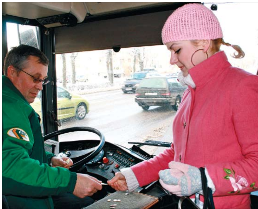
Šobrīd biļešu cena pilsētas autobusos ir 25 santīmi, no nākamā gada tā būs 30 santīmi.

Jāpiebilst, ka jaunais tarifs paredz vēl kādu niansi – sešos maršrutos, kas iziet ārpus pilsētas robežām, – līdz Jaunpēterniekiem, Dzirnīkiem, Garozai, Valgundes pagasta padomei, Vārpai