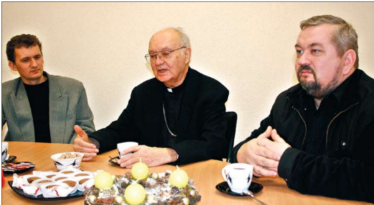
Pirms Ziemassvētkiem mācītājiem daudz darba. Sprotams, ka cilvēki uz svētkiem vēlas sakopt sevi ne vien ārēji, bet arī garīgi.

Rēdmanis: Kristieši no dažādām draudzēm apvienojas aktivitātēs. Mums jau ceturto gadu plānots koncerts. Katra draudze tajā piedalās ar savu sniegumu un ziedošanu konkrētiem mērķiem. Viens no tādiem ir muzikāls Ziemassvētku vakars nakts patversmē. Vēl daļa no kopīgiem ziedojumiem tiek cietumniekiem, kuriem nav neviena, kas kontā ieskaitītu naudu kaut vai tikai personīgās higiēnas lietu iegādei. Tāpēc sarūpējam paciņas ar nepieciešamo ikdienai. Pērn trešais virziens bija vēl nedzimušu bērnu aizsardzība. Kāda sabiedriska organizācija rīko ļoti labus kursus, lai palīdzētu grūtibās nonākušām