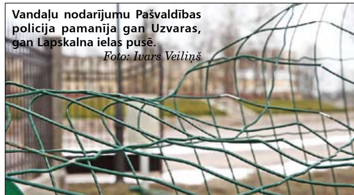
Vandāļu nodarījumu Pašvaldības policija pamanīja gan Uzvaras, gan Lapskalna ielas pusē.

Tā nav pirmā, bet gan vismaz ceturta reize, kad no vandāļu rīcības cieš Uzvaras parks. Par laimi, iepriekš, kad 2. februārī tika sasists laternas kupols, pateicoties kameru nofilēmātajam, vainīgajiem pēdas izdevās sadzīt.