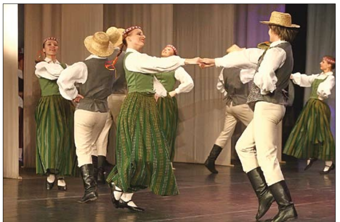
Marta vidū aizritējusi pilsētas un rajona deju kolektīvu skate, kurā tikās B, C, D, E un F grupu deju kolektīvi, jo A grupas kolektīvi jau bija uzstājušies Rīgā. Tautas deju ansamblis «Jaunība», startējot B grupā, ieguva 2. pakāpes novērtējumu.