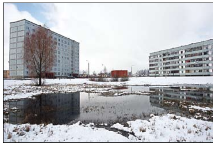
Iespējams, jaunu ēku būvniecība Pērnavas ielas 32. mājas apkaimē nāktu tikai par labu. Tomēr iedzīvotāji par nākotnes iecerēm grib saņemt detalizētāku informāciju.

Iedzīvotāji savstarpējas sarunās pēc tam pieļāvuši, ka, iespējams, firmai arī nav sliktu nodomu un būvniecība apkaimē nāktu tikai par labu. Tomēr pārstāvu uzvedības dēļ trūkstot uzticības. Šaubas saistītas arī ar pagājušā gada norisēm Loka maģistrālē – arī Pērnavas ielas 32. nama ie-