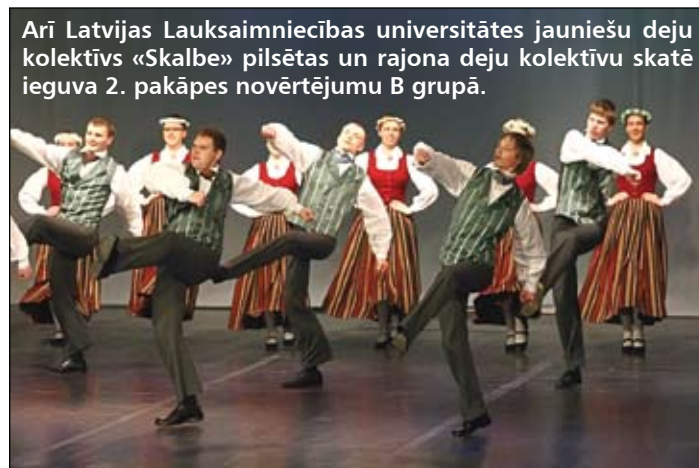
Arī Latvijas Lauksaimniecības universitātes jauniešu deju kolektīvs «Skalbe» pilsētas un rajona deju kolektīvu skatē ieguva 2. pakāpes novērtējumu B grupā.

«Jāsaka ļoti liels paldies mūsu pašvaldībai, kas jau trešo gadu atbalsta pilsētas mākslinieciskos