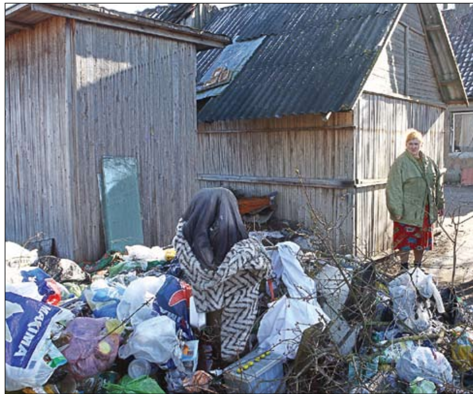
Iesaistīties Spodrības mēnesī arī šogad aicināti ne tikai uzņēmumi un organizācijas, bet arī ikviens jelgavnieks. Jāteic gan, ka daļai iedzīvotāju vieta, kur talkot, nebūs tālu jāmeklē, jo atkritumu kalni sakrājušies pat mājas tuvumā.