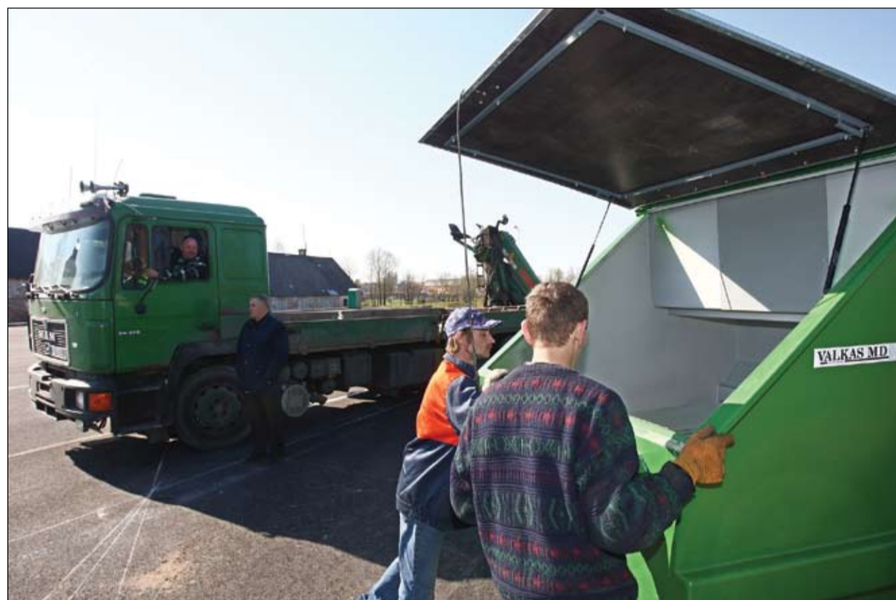
Dalītās atkritumu savākšanas laukumā Paula Lejiņa ielā izvietoti ietilpīgi konteineri, kur iedzīvotāji varēs bez maksas nodot sašķirotos atkritumus.