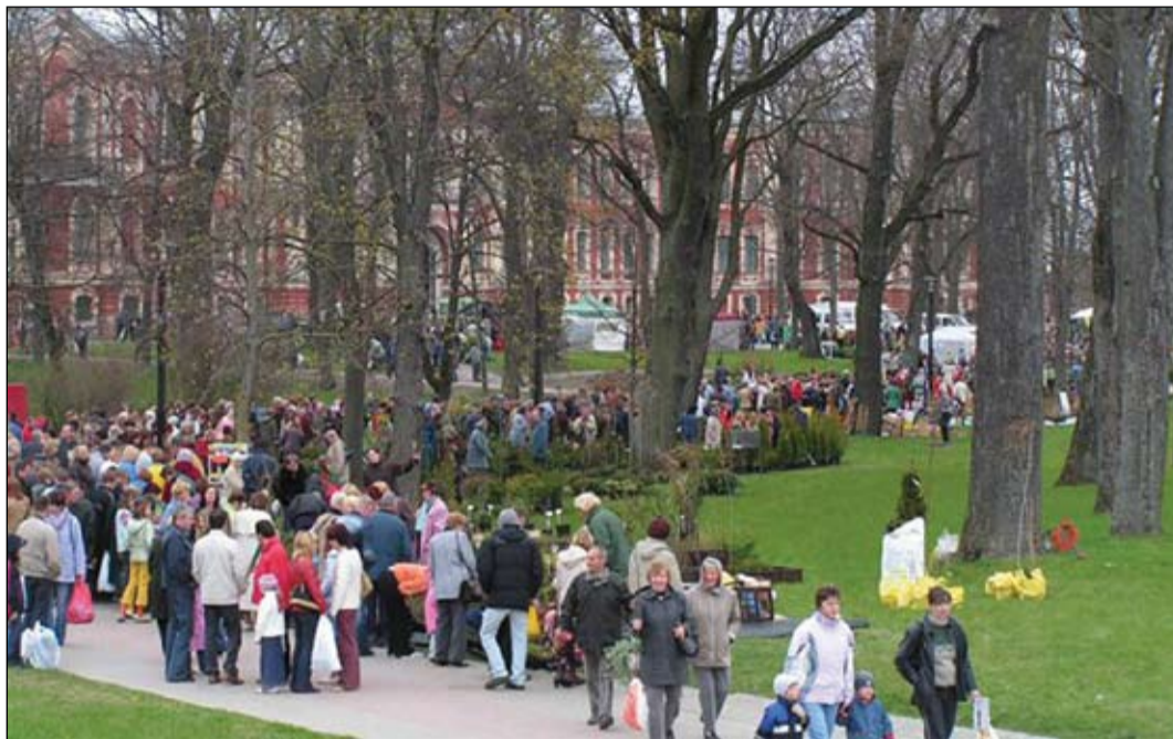
Šogad Stādu parādē piedalīsies gandrīz pusotrs simts tirgotāju no visas Latvijas, kas būs sarūpējuši visdažādākos stādus, kokus, krūmus, kā arī dārza aprīkojumu. Arī šoreiz tā būs iespēja iegādāties mūsu valstī izaudzēto.