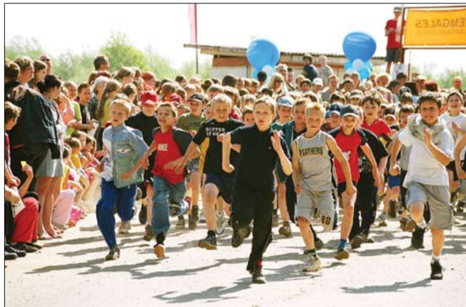
Pulcēšanās lielajai stafetei notiks Hercoga Jēkaba laukumā. Komandām, kas vēlas piedalīties, pieteikumi jāiesniedz ne vēlāk kā pusstundu pirms starta sacensību vietā.