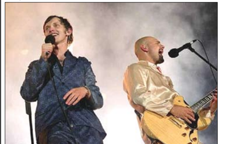
Radiostacijās jau skan «Prāta vētras» singls «And I lie», bet šopirmdien pirmatskaņojumu radio «Star FM» ēterā piedzīvoja otrais singls no jaunā albuma «Ja tikai uz mani tu paskatītos».

Jāpiebilst, ka grupa šogad piedzīvos ne tikai sava albuma izdošanu un koncerttūri pa Latviju, bet arī to, ka grupas solists Renārs Kaupers saņems Triju Zvaigžņu ordeni, ko viņam piešķirt nolēmis Ordeņu kapituls.