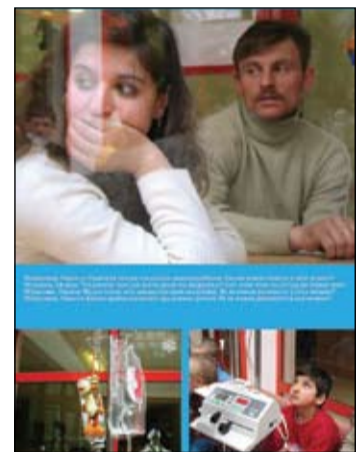
2006. gada martā tika organizēta fotomākslas meistarklase bērniem no trim Černobiļas atomelektrostācijas avārijā visvairāk cietušajām valstīm – Baltkrievijas, Krievijas un Ukrainas, un tika radīta bērnu fotodarbu izstāde «Černobiļa – bērna acīm», ko pērn varēja apskatīt arī Jelgavā. «Bērnu bildes lika aizdomāties, cik daudz likteņu sakropļojis šis neredzamais murgs – radiācija,» šādas un līdzīgas pārdomas pēc izstādes pauda apmeklētāji.

Jelgavā arī šogad – 22 gadus pēc traģēdijas – tiks rīkots atceres pasākums. «Mēs vēlamies pateikt paldies tiem, kas piedalījās avārijas seku likvidēšanā, izrādīt uzmanību,» J.Grisle viņus šodien, 24. aprīlī, pulksten 15 aicina uz Sabiedrības integrācijas biroju (Pulkveža Briēža ielā 26), kur sirsnīgā gaisotnē būs iespējams noklausīties svētku koncertu, kopā ar domubiedriem atmiņā atsaukt traģiskos notikumus un godināt aizsaulē aizgājušos.