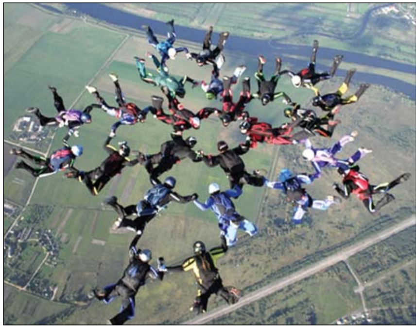
Šādas un līdzīgas mazākas un lielākas piruetes gaisā tiek veidotas virs Jelgavas. Šī figūra tapusi pagājušajā vasarā sacensību «Latvijas rekords» laikā.