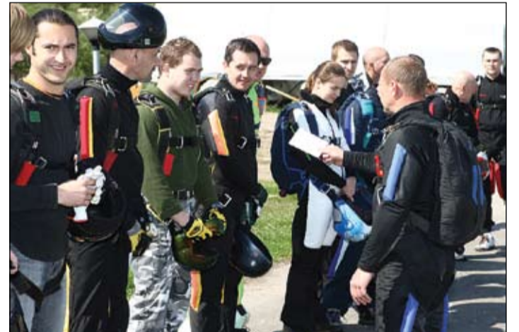
Instruktorus visus šīs dienas pirmos lēcējus sarindo tādā secībā, kā notiks lēkšana no lidmašīnas. To zināt ir ļoti svarīgi, lai nevarētu neveiklas kļūdas – piemēram, kāds kādam neuzlec virsū. Pirmie lec tie, kas lēcieni izpilda grupā, nākamie tie, kas pa diviem, un visbeidzot individuālie lēcēji.

Tiem cilvēkiem, kas pirmo reizi vēlas pamēģināt nolēkt ar izpletņi, vajadzētu veikt tandēma