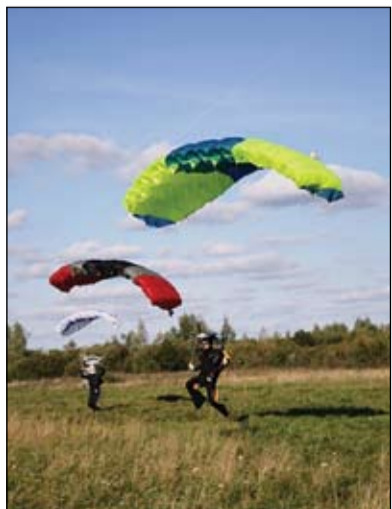
Vēl lidmašīnā instruktors izrēķinājis, kurā brīdī cilvēkam jālec, lai uz zemes piezemētos noteiktā punktā.

izpletņi izlēkt plānoja vairāk nekā 40 cilvēki, taču reizes, kad notiekot kādas lielākas sacensības, ierodoties pat līdz simts lēcēju no visas Latvijas un kaimiņvalstīm. Lielākā daļa šeit ir tādu, kas to dara sava prieka pēc, taču netrūkst arī to, kas lēkšanu ar izpletņi izvēlējušies kā sporta veidu. Arī ārzemnieki iecienījuši mūsu pilsētā pieejamo bāzi. Daudziem varētu šķist, ka izpletņlēcšanu lēkšanu izvēlas tikai ekstrēmisti, taču izrādās, ka tādi ekstrēmumu sajūtu meklētāji šeit ilgi nepaliekot. Pirmais lē-