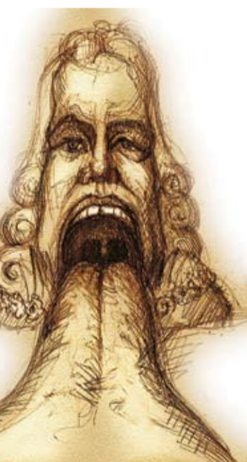
Kārļa Īles (Latvija) skulptūras «Uz mēles» skice

Starptautiskā smilšu skulptūru festivāla atklāšana – 13. jūnijā pulksten 19, taču skulptūras varēs aplūkot jau no pulksten 17 līdz 23. Pārējās dienās skulptūras būs apskatāmas no pulksten 10 līdz 22.