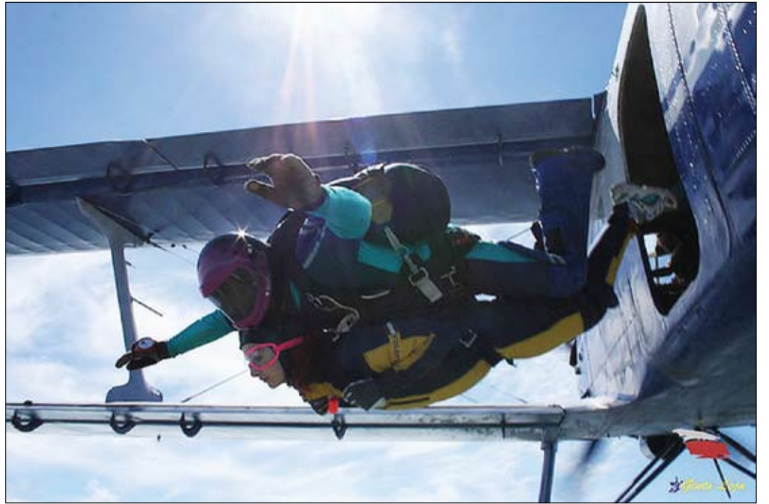
Tandēma lēciens no lidmašīnas – instruktors, kuram piekabināts vēl viens cilvēks, kam tikai jābaida vairāk nekā minūti ilgs brīvais kritiens un pēc tam lidojums zem izpletņa.