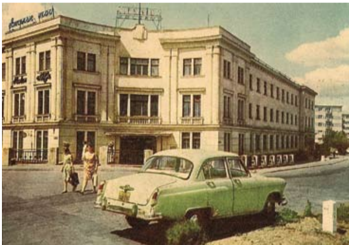
Skats uz viesnīcu «Jelgava».

Kamēr vieni izmanto aritmomētru, citi jau rēķināšanai ņem talkā pirmo elektronisko kalkulatoru.