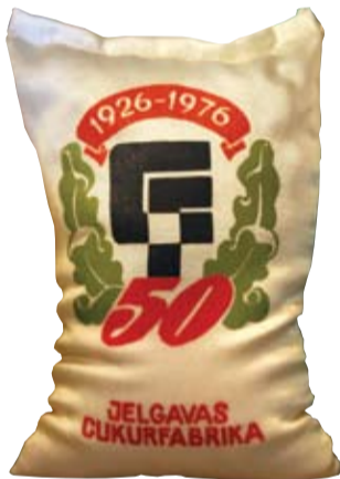
1976. gads – Jelgavas Cukurfabrika svin 50 gadu jubileju. Šim notikumam par godu top arī īpašs cukura fasējums.