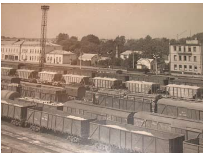
Jelgavas dzelzceļa stacija ap 1973. gadu.

Kārtības uzturēšanai pilsētā milicijai palīgā nāk civilpersonas. Patruļās tiek iesaistīti brīvprātīgie kārtības sargi, kuriem izsniedz speciālas apliecības un rokas lēntas.