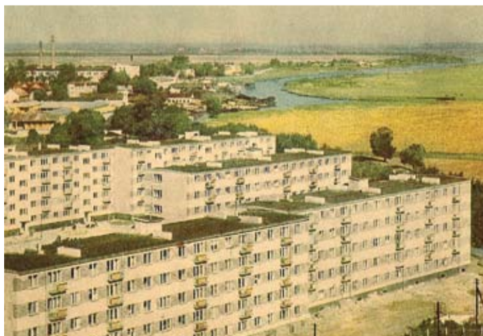
Septiņdesmitajos gados tiek izdotas vairākas krāsainas skatu kartes, kas paredzētas tūristiem. Lūk, viena šāda skatu kartīte ar jaunbūvētajiem pilsētas namiem un Driksu.