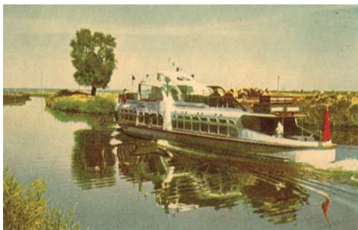
No Jelgavas uz Rīgu 70. gados varēja aizbraukt ar kuģi, kam bija zemūdens spārni.