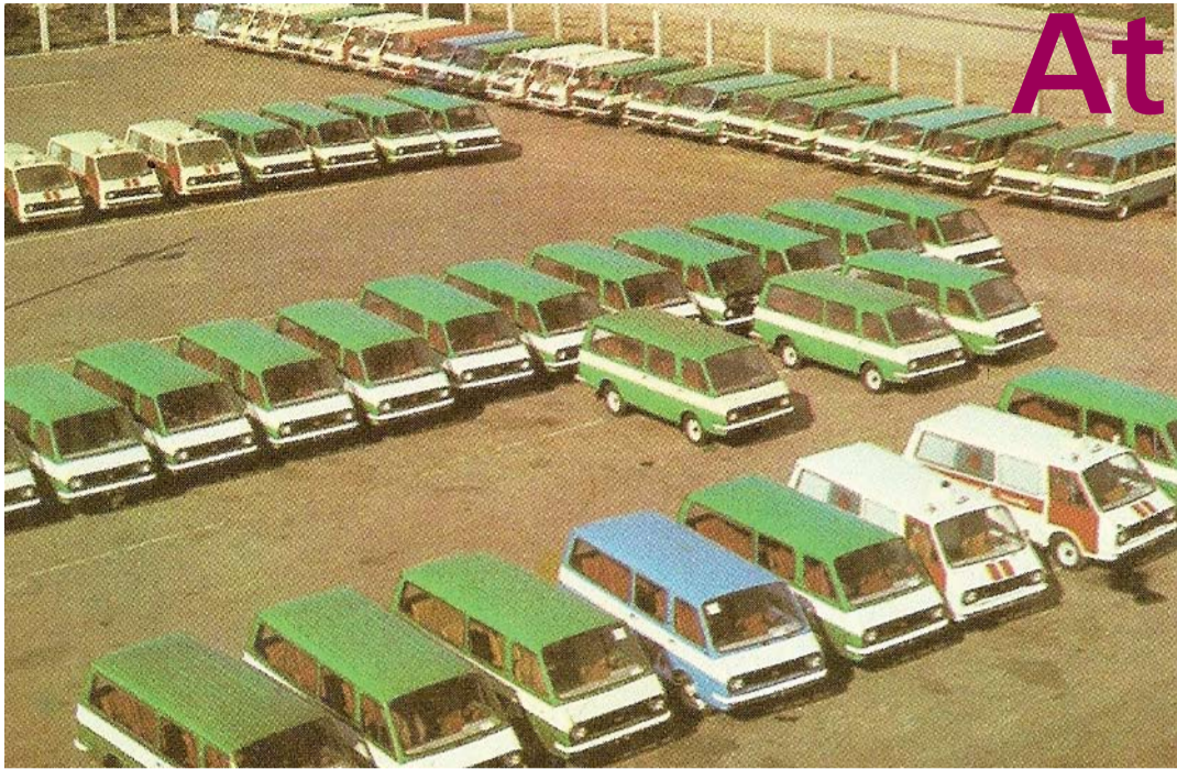
1969. gadā sāk būvēt RAF rūpnīcu. 1975. gadā jau tiek saražoti pirmie mikroautobusi.