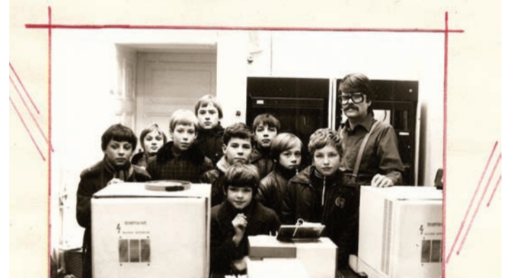
Fotogrāfija pulcēja biedri pie kompiutera SM-1.

1984. gada 28. februārī mūsu klases tūris-ta pulcēja biedri bija Rīgas svaigtlošanas iestādītā, kur redzēja: Kompiuteri: SM-1, kā arī svaigtlošanas un divu veidu lipogāzijas mašīnas. Tur mūs iemācīja spēli KVIŅGI.