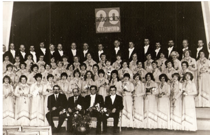
1981. gadā koris «Zemgale» svinēja 20 gadu jubileju.