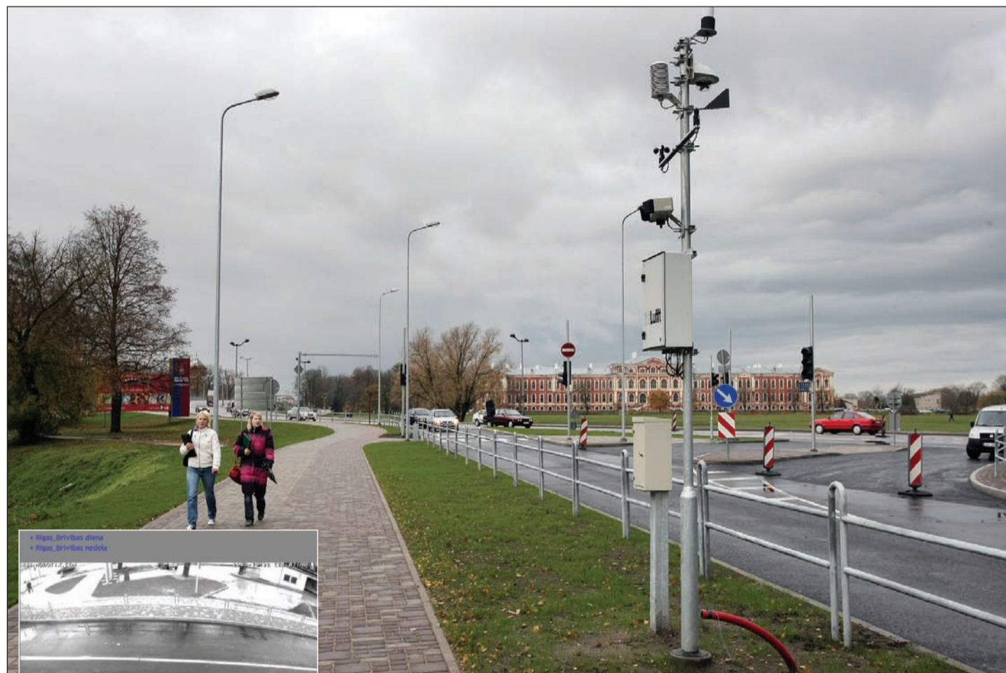
Šonedēļ uzņēmuma «Uni San» speciālisti veica priekšdarbus sensoru uzstādīšanai pie meteoroloģiskās stacijas Rīgas ielas un Brīvības bulvāra krustojumā.