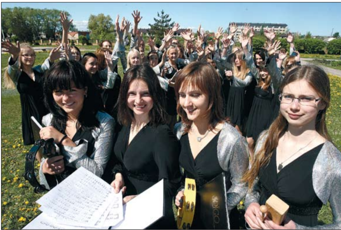
Uz labdarības koncertu «Palīdzi «Spigo» aizbraukt uz pasaules kora olimpiādi Dienvidkorejā» kora meitenes un atbalsītāji aicina ikvienu jelgavnieku, kurš gatavs palīdzēt «Spigo» nokļūt Dienvidkorejā.