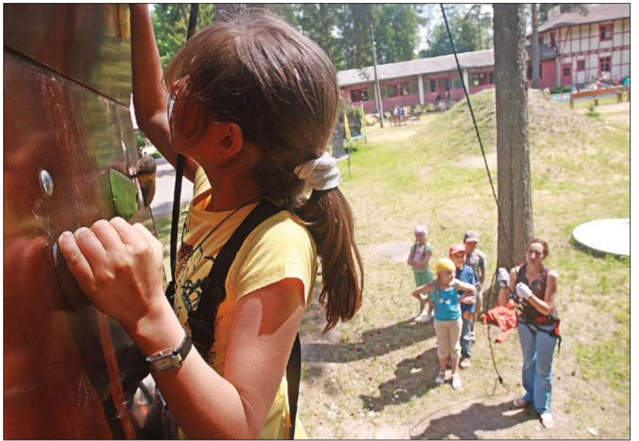
Jau nākamnedēļ sākas pieteikšanās «Lediņu» vasaras nometnei.