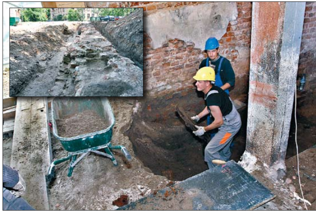
Svētās Trīsvienības baznīcas tornī sākušies rekonstrukcijas darbi, bet objektā strādā arī arheologi – viņi ir atrakuši vecās baznīcas pamatus un vairākus 17. gadsimta apbedījumus.