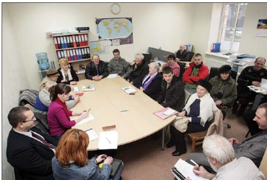
Jelgavas Nekustamā īpašuma pārvaldes apsaimniekotāju vecākie jau sanākuši kopā, lai apspriestu energoauditu rezultātus un lemtu par tālāko rīcību.

Ņemot vērā samērā augsto tehniskā nolietojuma procentu, iedzīvotājiem ir jāapzinās ēkas renovācijas nepieciešamība un jāplāno energoefektivitātes pasākumu ieviešana. Īpaša uzmanība būtu jāpievērš veco koka logu nomaiņai, jāpaaugstina pēdējā stāva, pagraba, bēniņu pārsegumu un citu norobežojošo konstrukciju siltumpretestība, jāveic kanalizācijas un ūdens stāvvedi nomaiņa,