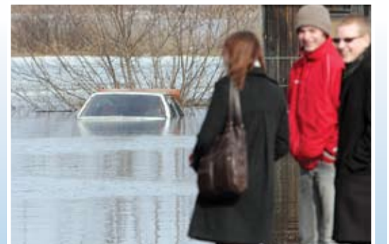
Kādā privātā teritorijā Uzvaras ielā nepatīkamu likteni piedzīvoja vieglā automašīna – ceturtdien tā bija teju pilnīgi zem ūdens. Šo skatu gribēja redzēt ne viens vien.

Sagatavoja Ritma Gaidamoviča