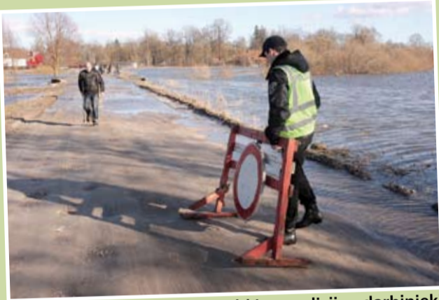
Jau 22. marta vakarā Pašvaldības policijas darbinieki izvietoja pirmo aizlieguma zīmi – Būriņu ceļā, kas ļāva iebraukt tikai seīti dzīvojošajiem. Jāteic gan, ka cilvēki steidza no turienes izbraukt, ne iebraukt, jo jau pēc pāris stundām ceļa vienkārši nebija – tikai ūdens. Taču vakarā Būriņu ceļš pārvērtās par tādu kā tūrisma objektu – cilvēki nāca, brauca, fotografēja, lai redzētu plūdu sākumu Jelgavā.

Atbildīgie dienesti sākuši detalizēti izanalizēt darbības plūdu laikā, lai iegūtie rezultāti nākotnē vēl efektīvāk ļautu reaģēt līdzīgās situācijās.