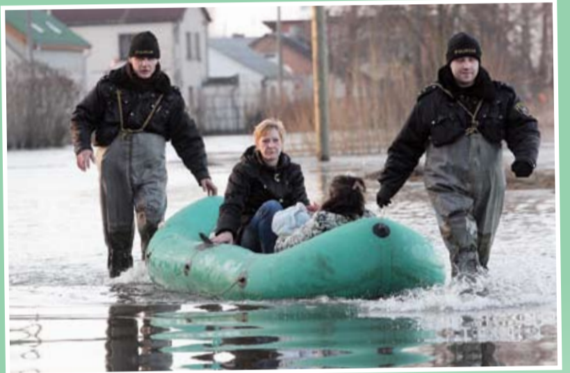
Visvairāk glābēju palīdzība bija nepieciešama 6. līnijas iedzīvotājiem. Tur ceturtdienas rītā Pašvaldības policijas darbinieki uz sauszemes nogādāja apmēram 30 cilvēkus – lai bērni tiktu uz skolu un pieaugušie uz darbu. Tieši no turienes saņemts arī viens no pirmajiem izsaukumiem par evakuāciju – dienesta viesnīcā nogādāta māte ar zīdaiņi.