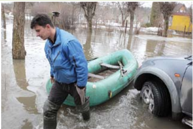
Ikdienā pa šo ceļu brauc 7. maršruta autobuss uz Kārņiņiem. Taču pagājušajā nedēļā vienīgais transporta līdzeklis, ar kuru varēja pārvietoties pa šo ceļu, ko drīzāk varētu nosaukt par upi, bija laiva. Protams, noderēja arī paši garākie gumijas zābakī.