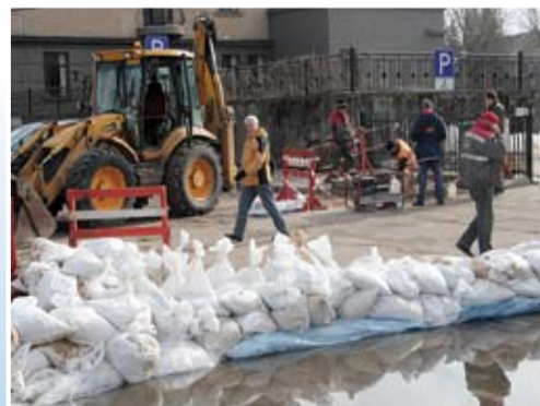
No krastiem «izkāpusi» Driksa ar palielu straumi plūda uz pilsētas pusi. Daļu Čakstes bulvāra tai arī izdevās appludināt, taču, lai tā neskartu viesnīcu «Jelgava», saimnieki ūdeni uz vēl neapplūdušās ielas daļas centās ierobežot, saliekot smilšu maisus. Lielākoties tas viņiem arī izdevās.