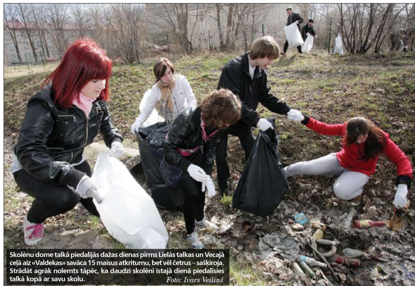
Skolēnu dome talkā piedalījās dažas dienas pirms Lielās talkas un Vecajā ceļā aiz «Valdekas» savāca 15 maisus atkritumu, bet vēl četrus – sašķiroja. Strādāt agrāk nolēms tāpēc, ka daudzi skolēni istajā dienā piedalīsies talkā kopā ar savu skolu.