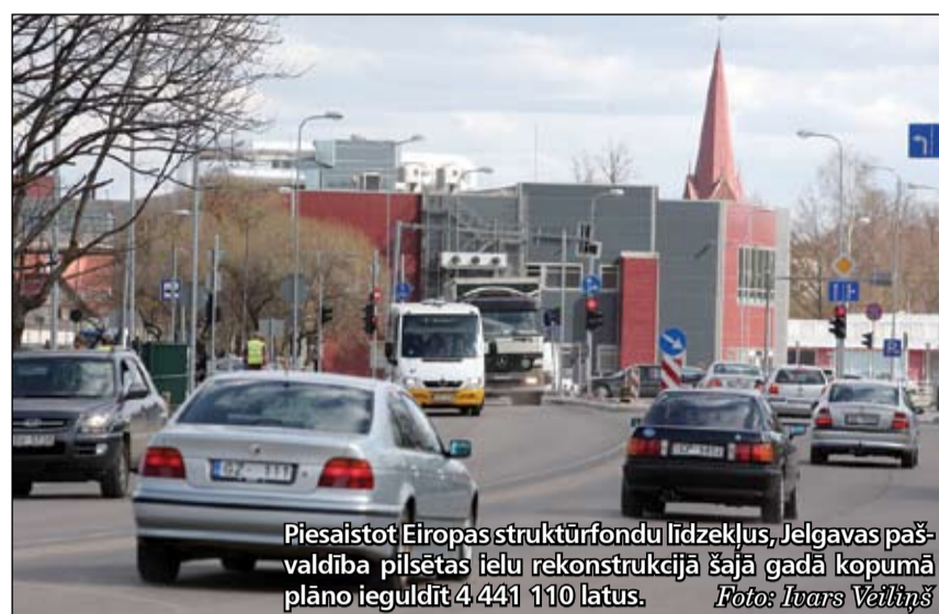
Piesaistot Eiropas struktūrfondu līdzekļus, Jelgavas pašvaldība pilsētas ielu rekonstrukcijā šajā gadā kopumā plāno ieguldīt 4 441 110 latus.

Pašlaik ielu remontdarbi pilsētā jau rit pilnā sparā, jo beidzot tam ir atbilstoši laika apstākļi, un, labojot bedrītes, iespējams izmantot bitumena emulsiju. Avārijas bedres salabotas jau iepriekš, un tagad aizdara pārējās bedres pilsētas ielās. «Šogad finansējums no Autoceļu fonda bedrīšu remontiem, salīdzinot ar iepriekšējo gadu, samazināts par 96 400 latu, taču mēs nedrīkstam pieļaut, ka līdzekļu samazinājuma dēļ ielas paliek bedrainas. Ceļi tiek laboti un tiks laboti arī turpmāk. Protams, atsevišķās ielās, kas ir kritiskākā stāvoklī, ir grūti runāt par ļoti komfortablu braukšanu, jo «lāpīta» ceļa stāvokli nevar salīdzināt ar vienlaidus uzklāta asfalta kvalitāti – praktiski nav iespējams bedri salabot tā, lai pa plaisiņām tajā neieķļūtu ūdens un neveicinātu «ielāpa» izsišanu, taču samazināt finansējuma dēļ mēs nedrīkstam aizmirst par