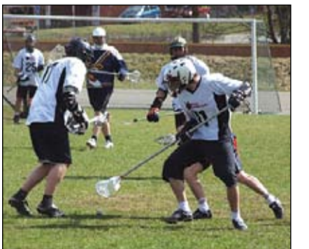
Sācies Latvijas čempionāts lakrosā. Pirmo spēli aizvadījis arī Jelgavas klubs «Mītava», ar 6:2 uzvarot «Valmieras puikas». Tomēr šosezon galvenais lakrosa notikums ir pasaules čempionāts, uz kuru Latvijas izlases sastāvā gatavojas doties seši jelgavnieki.

Jauno sezonu veiksmīgi iesākuši Jelgavas lakrosisti «Mītava» – viņi nedēļas nogalē aizvadīja pirmo Latvijas čempionāta spēli un ar 6:2 pieveica «Valmieras puikas». Šīs sezonas mērķis lakrosistiem ir nosargāt trešo vietu, pabojāt nervus līderiem, kā arī aizbraukt uz pasaules čempionātu.