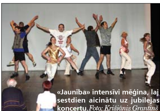
«Jaunība» intensīvi mēģina, laj sestdien aicinātu uz jubilejas koncertu.

Biļetes cena uz koncertu – 1,50; 1 un 0,50 lati. Biļetes jau nopērkamas Jelgavas kultūras nama kasē.