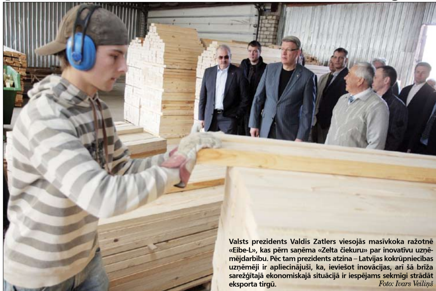
Valsts prezidents Valdis Zatlers viesojās masīvkoka ražotnē «Eibe-L», kas pērn saņēma «Zelta čiekuru» par inovatīvu uzņēmējdarbību. Pēc tam prezidents atzina – Latvijas kokrūpniecības uzņēmēji ir apliecinājuši, ka, ieviešot inovācijas, arī šā brīža sarežģītajā ekonomiskajā situācijā ir iespējams sekmīgi strādāt eksporta tirgū.