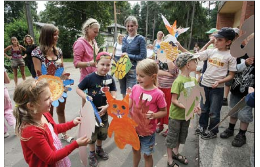
Nometne spēs uzņemt simts bērnu dienā, nodarbības notiks darba dienās no pulksten 9 līdz 18, turklāt bērni uz «Lediņiem» tiks aizvesti ar autobusu un arī atvesti atpakaļ.

vajadzībām kopā ar pavadoņiem, vēlams, vecāku brāli vai māsu. Šiem bērniem nodarbības netiks rīkotas atsevišķi,