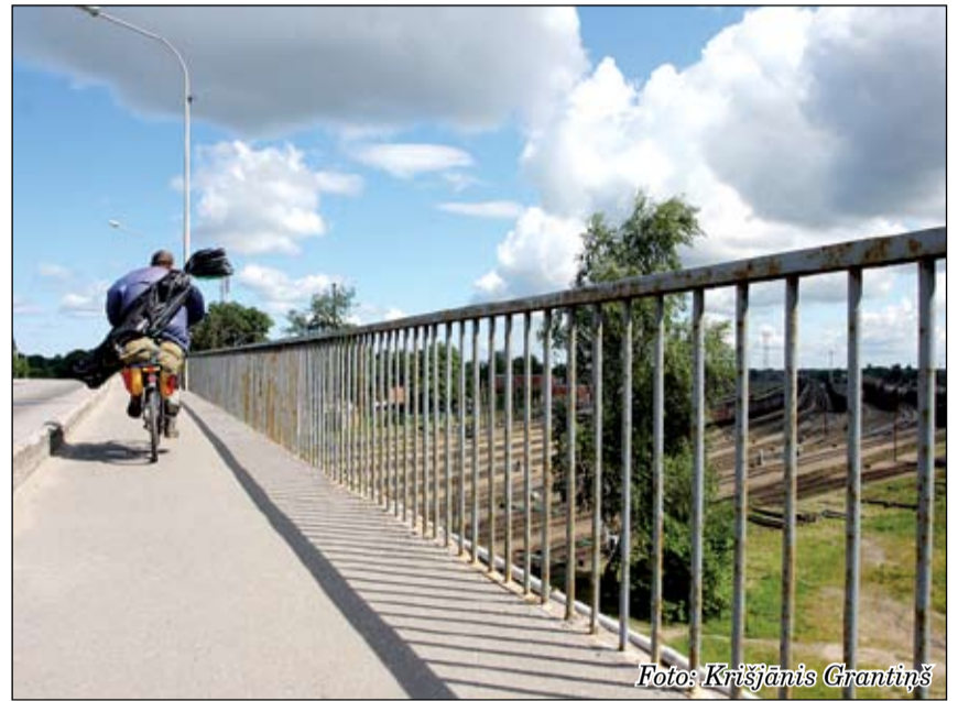
Gaisa tilta margu augstums atbilst Latvijas valsts standartam, tādēļ vismaz tuvākajā laikā jautājums par margu paaugstināšanu netiks izskatīts.