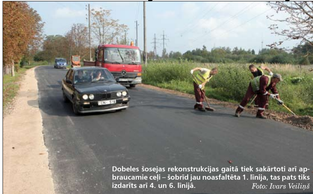
Dobeles šosejas rekonstrukcijas gaitā tiek sakārtoti arī apbraucamie ceļi – šobrīd jau noasfaltēta 1. līnija, tas pats tiks izdarīts arī 4. un 6. līnijā.