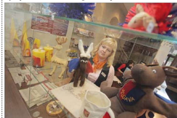
Suvenīri Svētās Trīsvienības baznīcas tornī apskatāmi līdz 22. maijam. Tāpat līdz 22. maijam iespējams nobalsot par savu favorītu – gan tornī, gan mājas lapā www.jelgava.lv , sadaļā «Aktuāli». Uzvarētāji tiks apbalvoti Pilsētas svētku laikā.

Šāds konkurss rīkots, lai papildinātu Jelgavas suvenīru klāstu, un interesantāko ideju autoriem būs iespēja savus darbus piedāvāt Sv. Trīsvienības baznīcas tornī un citās suvenīru tirdzniecības vietās. Jāpiebilst, ka šajā tūrisma sezonā akcentēta tiek tieši Jelgavas popularizēšana, un jauni un interesanti suvenīri varētu būt viens no veidiem, kā popularizēt mūsu pilsētu.