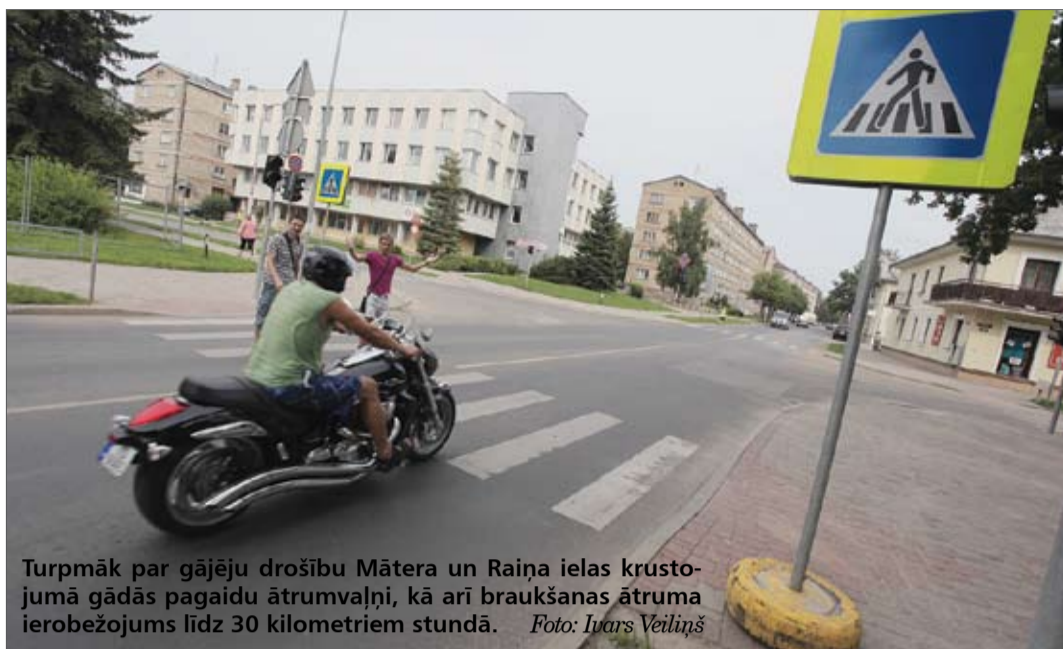
Turpmāk par gājēju drošību Mātera un Raiņa ielas krustojumā gādās pagaidu ātrumvaļņi, kā arī braukšanas ātruma ierobežojums līdz 30 kilometriem stundā.