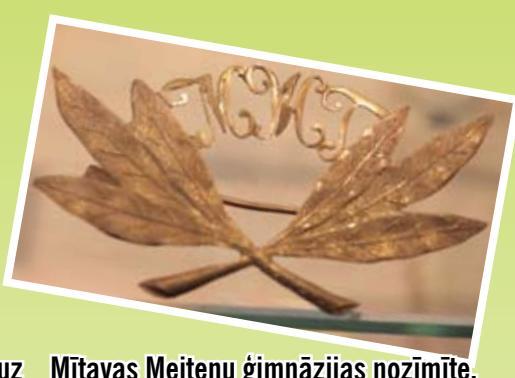
Mītavas Meiteņu ģimnāzijas nozīmīte. 20. gadsimta sākums.