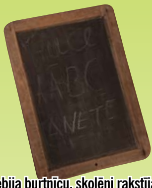
Kad vēl nebija burtiņu, skolēni rakstīja uz tāfeles ar striķīti piesietu grifeli.