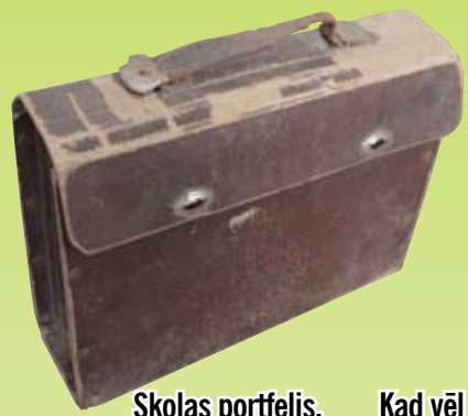
Skolas portfelis. 20. gadsimta 40. gadi.