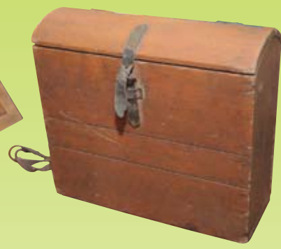
Koka mugursoma. 19. gadsimta beigas.