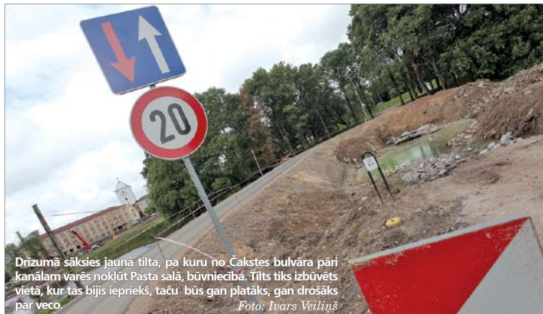
Drīzumā sāksies jaunā tilta, pa kuru no Čakstes bulvāra pāri kanālam varēs nokļūt Pasta salā, būvniecībā. Tilts tiks izbūvēts vietā, kur tas bijis iepriekš, taču būs gan platāks, gan drošāks par veco.