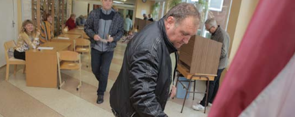
Vairums uzrunāto vēlētāju pilsētā atzina, ka no jaunās valdības būtiskus uzlabojumus negaida, jo pirmsvēlēšanu solījumiem netic un apzinās reālo situāciju.