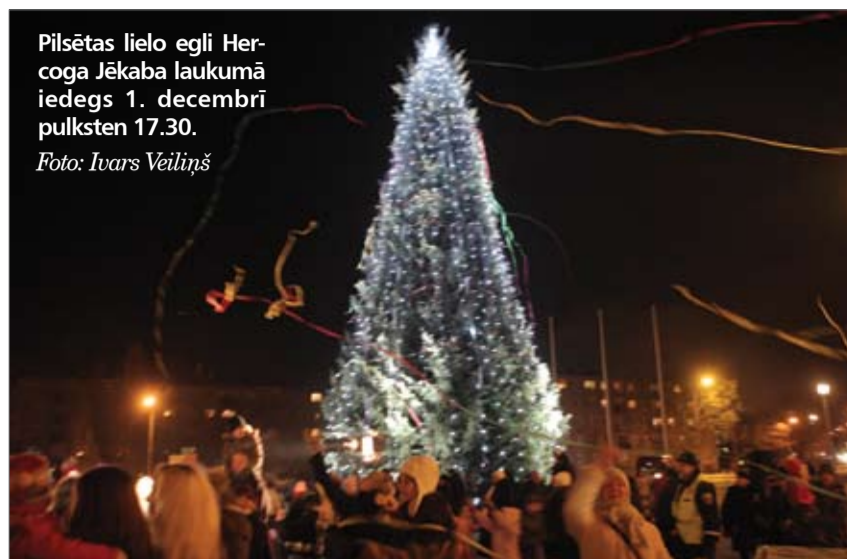
Pilsētas lielo egli Hercoga Jēkaba laukumā iedegs 1. decembrī pulksten 17.30.