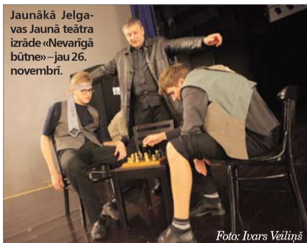
Jaunākā Jelgavas Jaunā teātra izrāde «Nevarīgā būtne» – jau 26. novembrī.