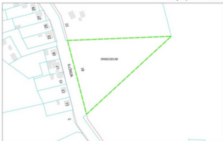
Detālplānojuma izstrādes robeža