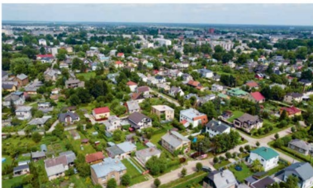
► Kristīne Langenfelde

aplīks ar paaugstinātu nodokli; termiņš – 2022. gada 30. septembris