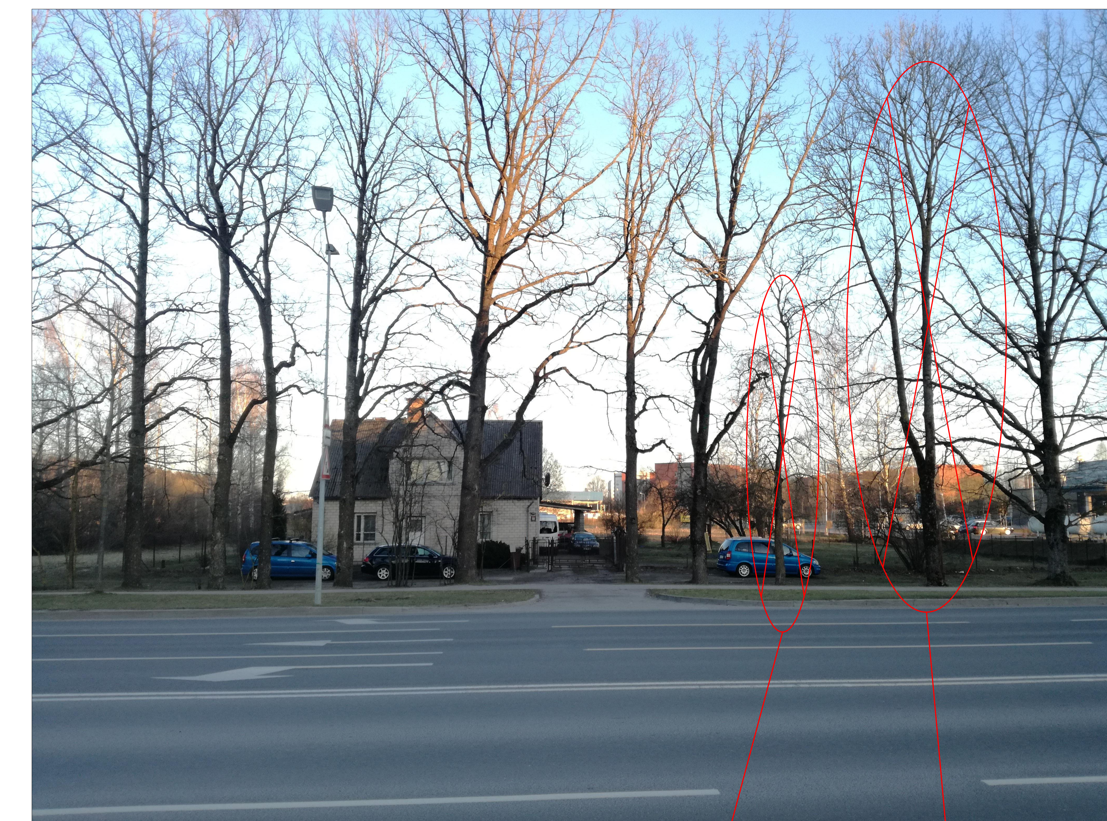
Cērtamais koks Nr. 1 zirgkastaņa, D=40 cm