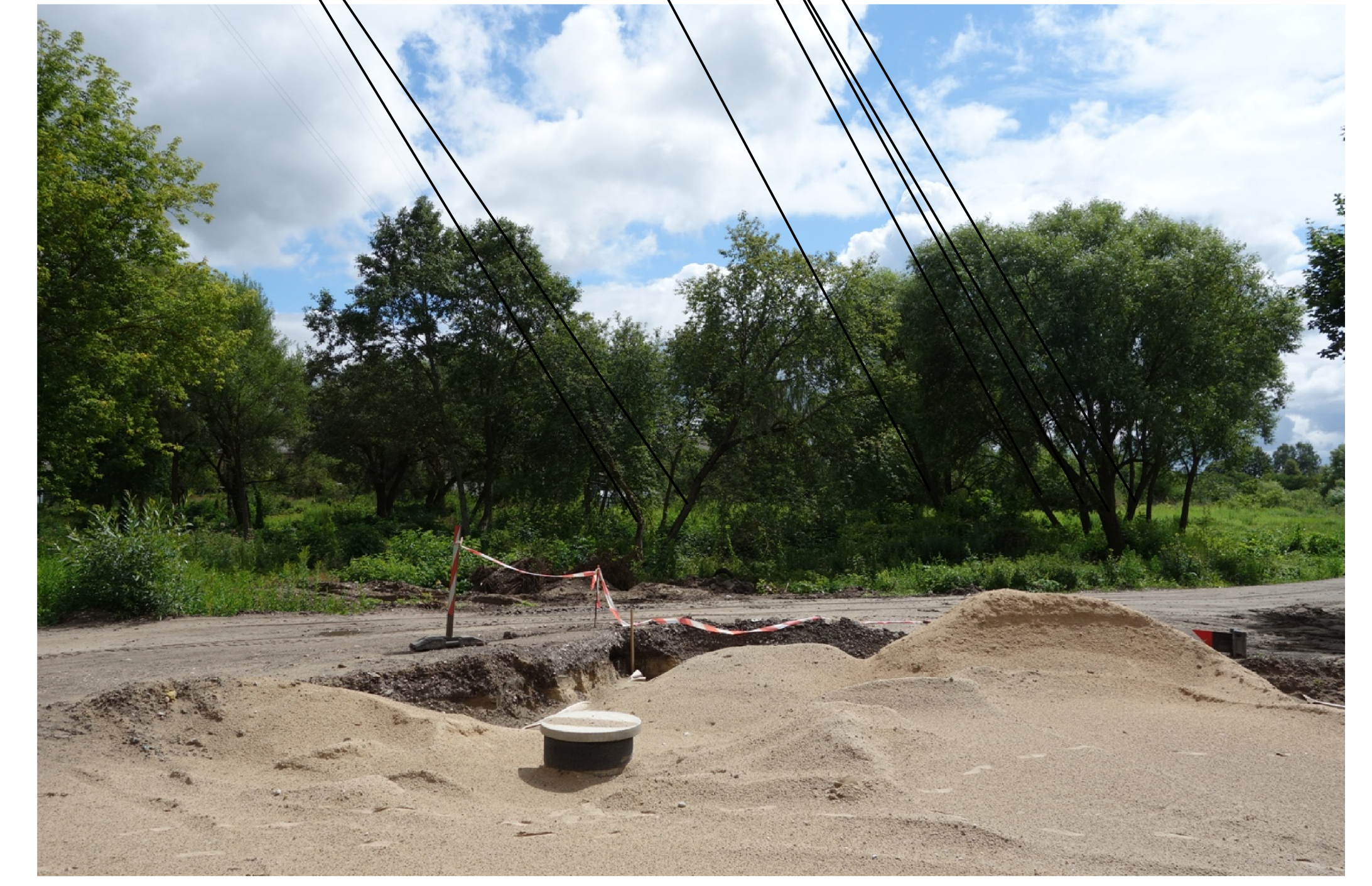
Cērtamo koku vieta